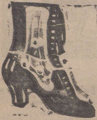
Gran surtido en todas clases, y sección económica a precios de fábrica.

En la Delegación del Comité del Nitrato de Sosa de Chile, Almirante 19, Madrid, se resuelven gratuitamente las consultas relativas a la aplicación de este abono, que se hagan por carta ó verbalmente, y se envían folletos que tratan de la fertilización de los diversos cultivos que pueden interesar al agricultor español.