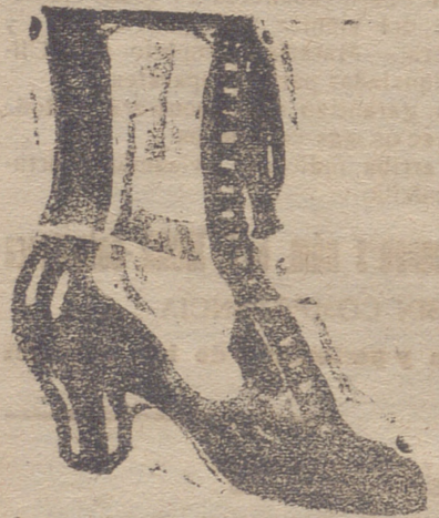
Gran surtido en todas clases, y sección económica a precios de fábrica.

producto enológico preparado con materias químicamente puras y en proporciones exactas ajustadas a las que tolera la ley. Este producto es completamente inofensivo. Se aplica, después de hecho el vino, para corregir ó prevenir cualquier alteración, en la proporción de un kilo por cada 250 arrobas de 16 litros. Precio: 14 pesetas el kilo, 7'50 el medio kilo. Prospectos y pedidos a la administración de LA INFORMACION AGRICOLA: Almirante, 19, Madrid.—Apartado núm. 6.