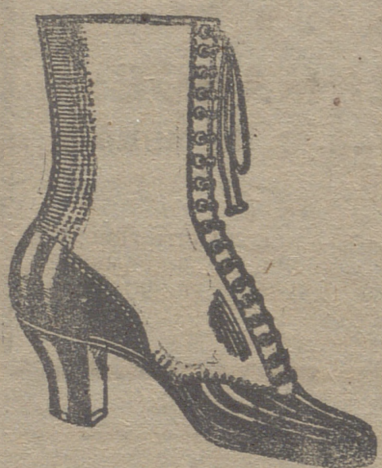
Gran surtido en todas clases, y sección económica a precios de Fábrica.

GRAN BAZAR DE CALZADO EMILIANO DOMINGO Mercado, núm. 10.