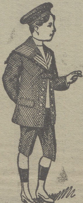
- 50 modelos diferentes - en trajecitos de niños, en gerga, paño y pana.