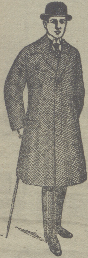
Gabanes de caballero desde 40 pesetas á 125. - - - Últimas novedades - - -

PLAZA MAYOR, 42 y LAIN-CALVO, 9. :: Sucursal: PALOMA, 9.