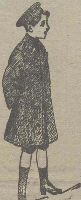
Grandes surtidos recibidos para la temporada en gabanes de jóvenes y niños