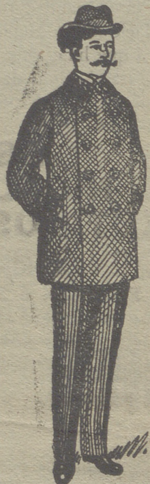
Pellizas desde 18 pesetas á 75. - - - Gran surtido - - -