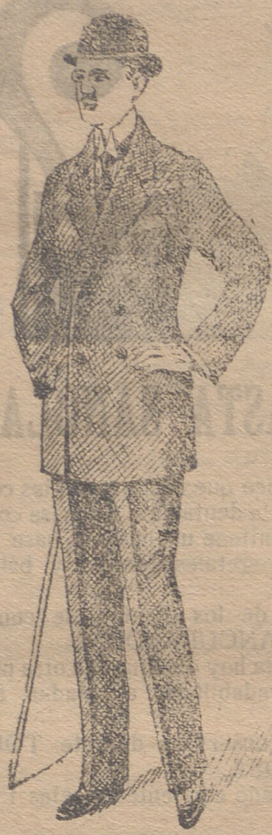
Trajes caballero de paño pana y dril

Esta casa presenta siempre grandessurtidos en trajes de caballero, joven y niños y espléndido surtido en toda clase de prendas sueltas para toda clase de trajes.