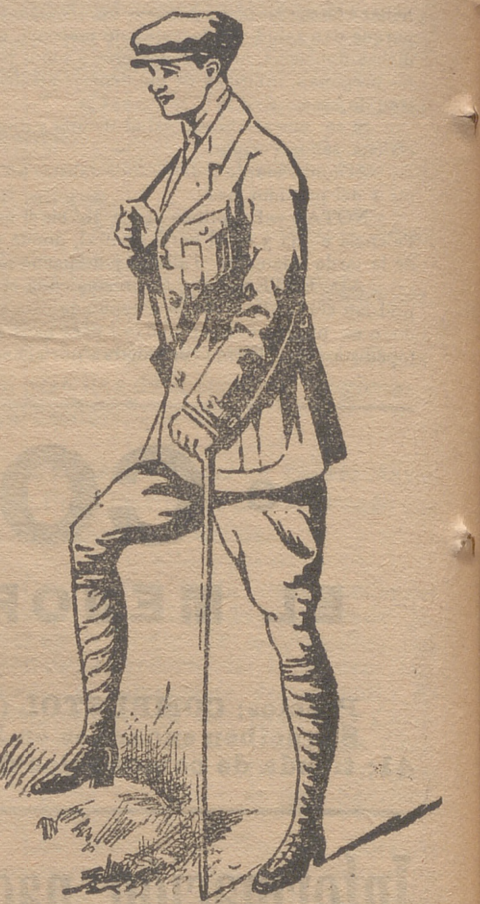
Trajes export en paño, dril y pana.

Grandes surtidos en lanería y pañería de caballero y seño