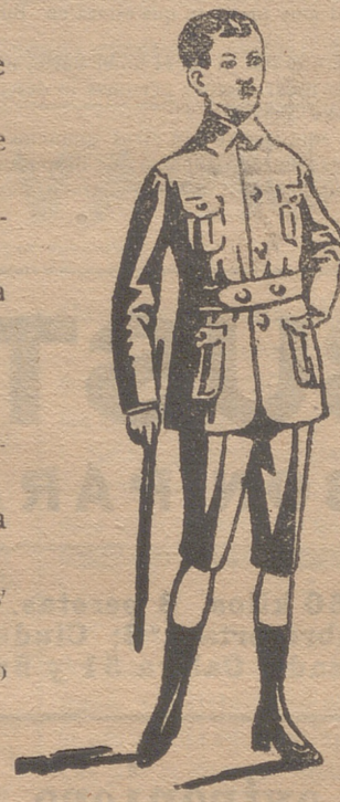
Trajecitos export y ra. forma corriente en paño, paña y dril.

En blanco hay bonitos modelos para la Sgda. Comunión y lazos para lo mismo