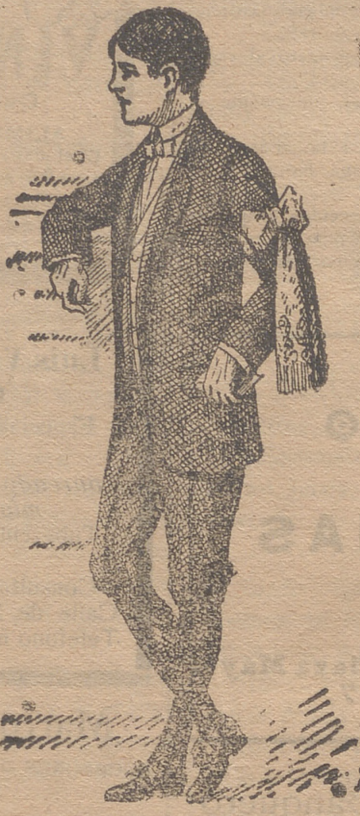
50 modelos en diferentes trajecitos de niño para primera comunión

Guardapolvos de caballero, señora y niño.