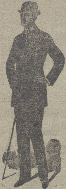
Gabanes de caballero de 30 á 125 ptas.

UNICA CASA QUE PRESENTA GRANDES SURTIDOS EN TEJIDOS Y ROPAS HECHAS DE CABALLERO SEÑORA Y NIÑO