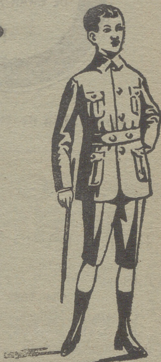
Trajes de jovencitos forma export y corriente en paño, pana y drill.

de señora y niños, corsés, medias en gasa, seda hilo y algodón, toquillas pelerinas en pelo cabra y lana. Lanería y pañería para señora, paños patentes y panas para caballero