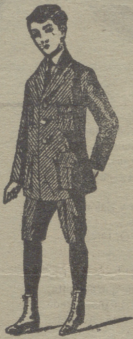
50 modelos diferentes en trajeitos de niño, en paño, grega y pana.

pas, mantones, mantillas de seda, tapabocas, mantas de Palencia, género de punto paraguas, guantes, gorras, boinas, calcetines ligas, tirantes, cuellos-cauchut, piqué y plancha.