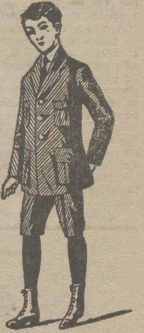
Trajes de jovencitos forma export y corriente en paño, pana y drill.

- - La casa que más surtido presenta - -