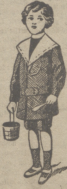
50 modelos diferentes en trajecitos de niños en paño gerga y pana.

:- Guardapolvos de caballero, señora y niños :-