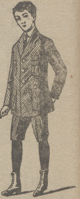
Trajes de jovencitos forma export y corriente en paño, pana y dril.

:- Grandes surtidos en camisería y corbatería :- Abrigos de señora desde 20 ptas. á 60 :- Abrigos de niña con cuello de piel desde 15 ptas. á 50 :- Capitas impermeables de niños y niñas.