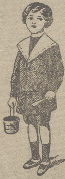
50 modelos diferentes en trajecitos de niños en paño gerga y pana.

Ultimos modelos en gabanes de caballero, jóvenes y niños :- Trajes de caballero en paño y pana :- Trajes export de paño y pana, y trajes completos azules para mecánicos y motoristas.