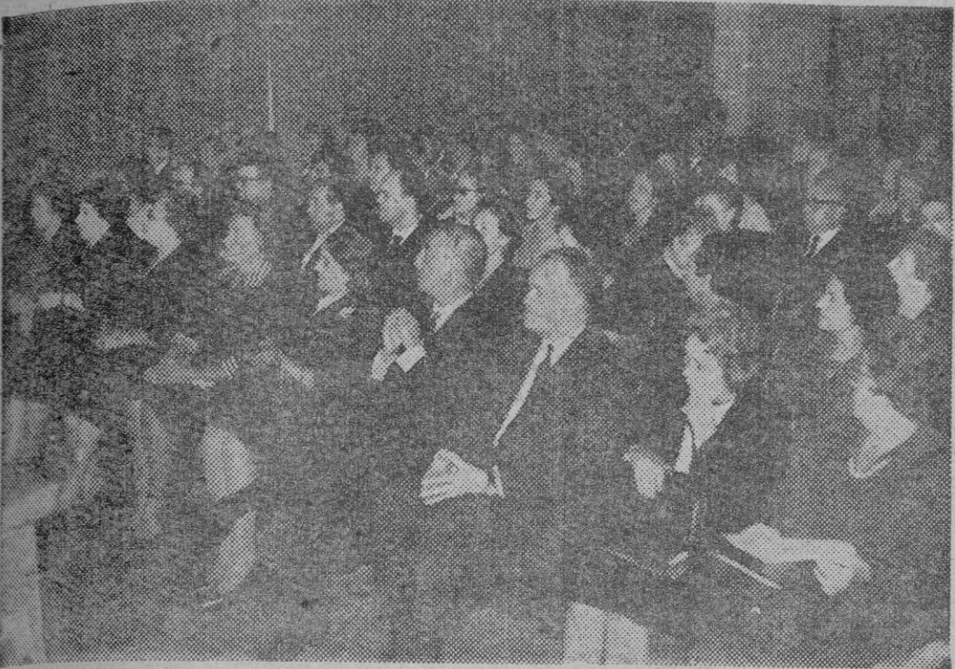
Los asambleístas durante el acto de clausura.