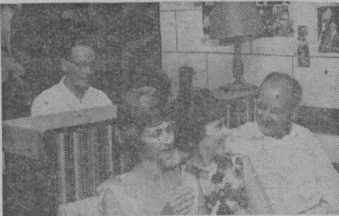
EL MUSICO TOCANDO EN UN LOCAL PALMESANO: PUEDE TOCAR SIN PARAR DURANTE TREINTA HORAS O MAS.

—Una melodía romántica que incluso hacia llorar a los soldados cuando ya guerra. Se titula "Beautiful dreamers". La he tocado centenares de miles de veces en Middlessex, Essex, Kent, Londres, París... y Palma de Mallorca. Cada