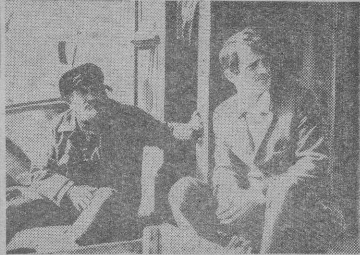
UNA ESCENA DEL FILM «ESCAPE LIBRE»

ma, en el apís de Olga. David, naturalmente, corteja a la deliciosa alemana. Arde en deseos de saber en que parte del automóvil, que es un «Triumph», está disimulado el oro—300 kgs. Olga evita responderle, pero un día, David se entera de que el oro está en la carrocería. A partir de ese momento no tiene más que una idea en la cabeza: apoderarse del automóvil. Pero el asunto no es tan fácil. Después de numerosas peripecias, David se resignará a quedarse sin el «Triumph». En contrapartida tendrá a Olga.