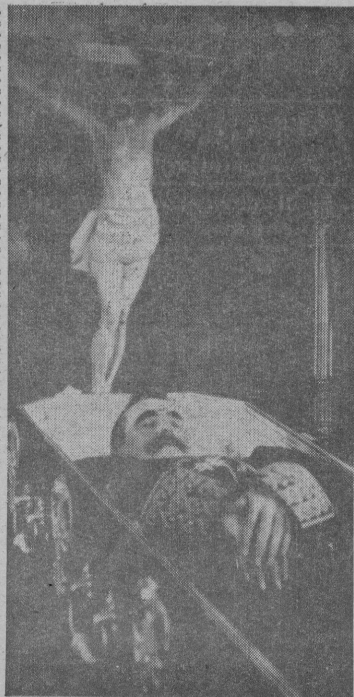
EL CADAVER DE CANALEJAS EXPUESTO AL PUBLICO EN LA CAPILLA ARDIENTE INSTALADA EN EL CONGRESO.