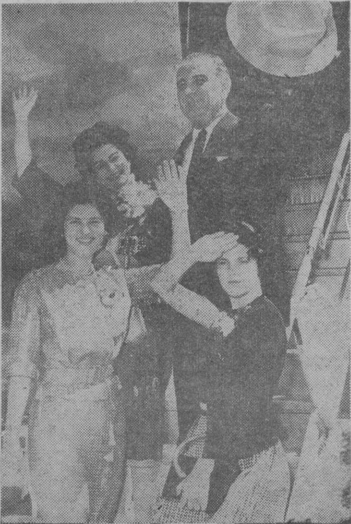
JOHNSON EN FAMILIA

la Dry Food Corporation, con lo que los bienes conyugales ascienden a un par de millones de moneda norteamericana. Un patrimonio que no (Continúa en página 17)