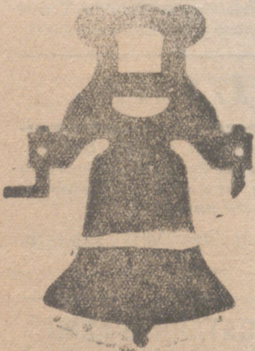
Campana con yugo de hierro de una sola pieza

Calle de Francia y Portal de Urbina VITORIA (ALAVA)