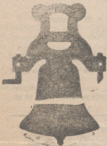
Campana con yugo de hierro de una sola pieza

Calle de Francia y Portal de Urbina VITORIA (ALAVA)