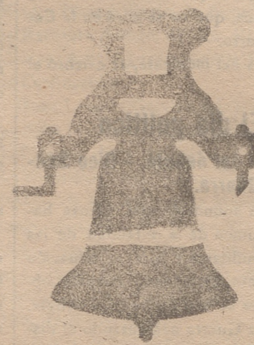
Comienza con yugo de hierro de una sola pieza

Calle de Francia y Portal de Urbina VITORIA (ALAVA)