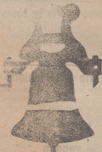
Campana con yugo de hierro de una sola pieza

Calle de Francia y Portal de Urbina VITORIA (ALAVA)