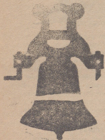
Campana con yugo de hierro de una sola pieza

Tenemos el gusto de expresar á continuación algunas de las obras realizadas en estos últimos años en Burgos y su provincia, á fin de que los interesados conozcan esta clase de trabajos, puedan ver palpablemente la superioridad de los productos de esta casa.