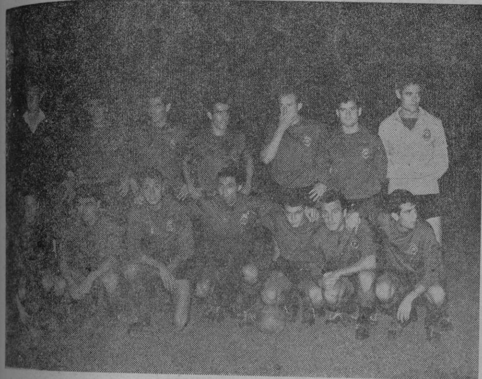
EN PRIMERA POSICION

R.C.D. Mallorca que tras vencer en su encuentro del sábado al Atco. Baleares por 1-0 suma dos puntos y queda en primera posición. Esta fue la formación inicial con que se presentó en el campo.