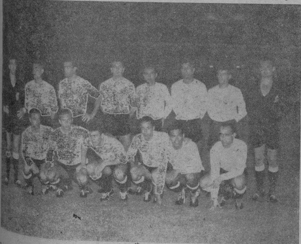
EN SEGUNDO LUGAR

R.C.D. Mallorca que tras vencer en su encuentro del sábado al Atco. Baleares por 1-0 suma dos puntos y queda en primera posición. Esta fue la formación inicial con que se presentó en el campo.