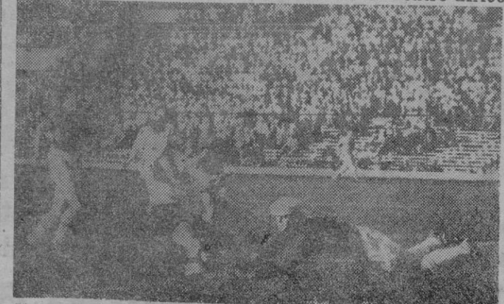
Una de las muchas jugadas captadas y que podremos ver en el transcurso del film.