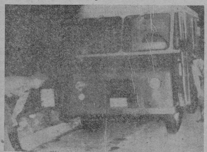
En la autopista que desde Cape Cod a Boston, en el Estado norteamericano de Massachussets, cinco hombres y una mujer atracaron un camión de Correos y se llevaron la bonita suma de millón y medio de dólares (noventa millones de pesetas). En la foto la policía examina, en plena carretera, el furgón a los pocos minutos de ser cometido el delito.