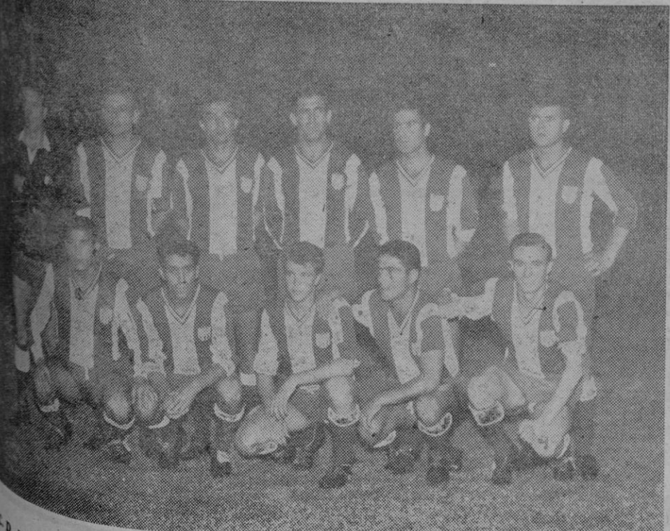
DE MOMENTO EN TERCER LUGAR

R.C.D. Constancia de Inca que ha disputado solo un partido frente al Atco. Baleares finalizando la jornada con empate a un tanto. Mañana se sabrá si sube un puesto más, si se queda donde está o si ha de pasar a ocupar el tercer puesto. Según sea el resultado con el Mallorca.