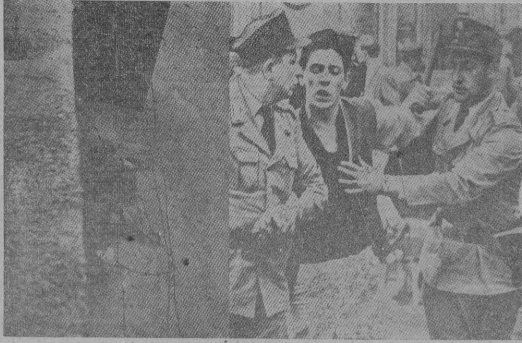
Nueva tensión en Berlín. Varios millares de alemanes se manifestaron indignados contra la policía soviética que asesinó a un joven cuando trataba de huir del Berlín Oriental. Los manifestantes apedrearon, no solo a los «vopos», sino incluso a los policías occidentales que trataban de disolverlos. En el montaje, el joven que agonizó sobre la «muralla de la vergüenza» y otro joven manifestante al ser detenido por agentes de la policía del Berlín Occidental.

SE AGRAVA LA SITUACION Berlín, 20.—Una multitud de (Continúa en la pág. siguiente)