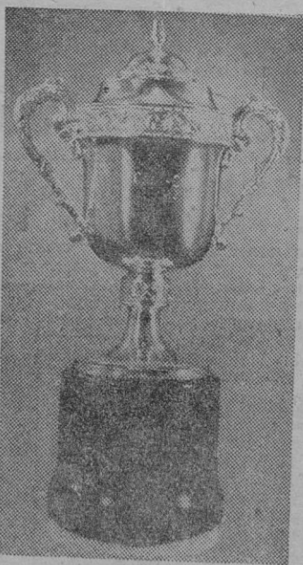
Trofeo Coca-Cola que se disputa en el Torneo Triangular