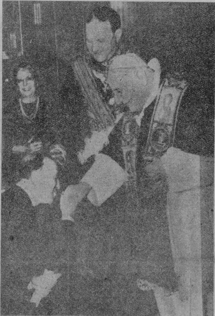
Su Santidad recibió en audiencia especial a la Misión española que ha asistido a los actos celebrados en su homenaje. Juan XXIII recibe, en presencia del Ministro español de Asuntos Exteriores, el homenaje de la representación española.