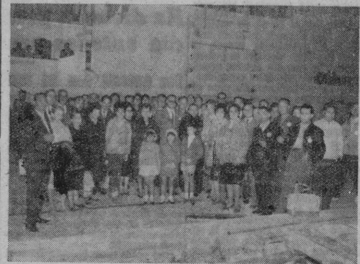
Los peregrinos sindicales momentos antes de subir al barco de Barcelona.

Organizada por la Delegación Nacional de Sindicatos se emprendió ayer en toda España la gran peregrinación a Roma, homenaje Nacional de los Sindicatos españoles a S. S. el Papa Juan XXIII, con motivo de la promulgación de la Encíclica «Mater et Magistra».