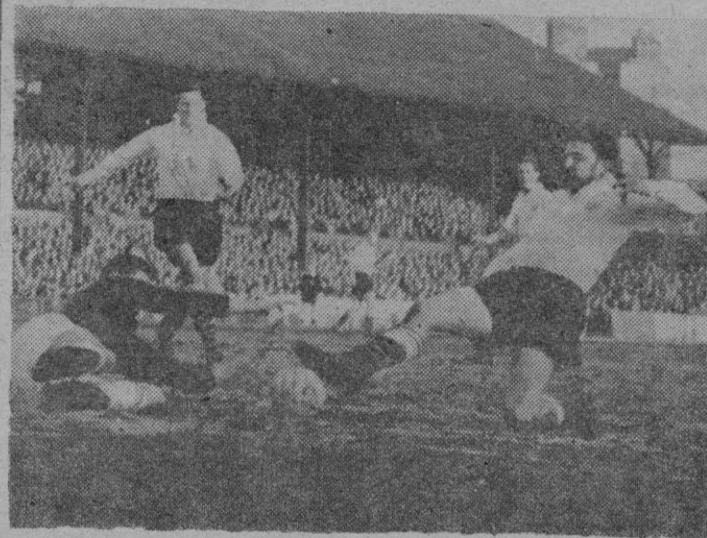
El barbudo Jimmy Hill, presidente de la Asociación Profesional de Futbolistas Ingleses y líder de las reivindicaciones profesionales de los mismos, que estuvieron a punto de concluir en una huelga, ha vuelto a jugar. Jimmy ha estado tres meses sin hacerlo, como consecuencia de la lesión sufrida en una pierna. En la foto, el delantero barbudo remata a gol en el encuentro celebrado en Stanford entre su equipo, el Fulham y el Chelsea.