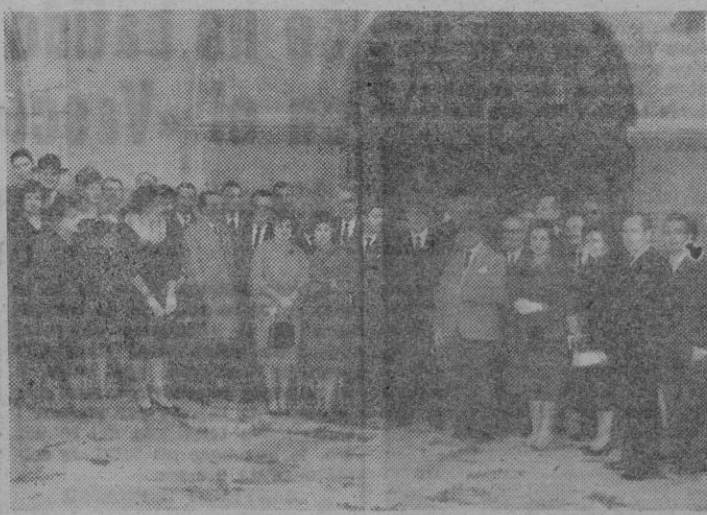
Grupo de asistentes a la misa, a la salida de la misma.

Ayer por la mañana, a las 11, en la parroquial iglesia de San Miguel, se celebró en el altar de la Virgen de la