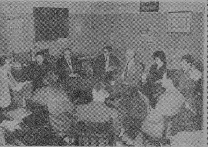
Un momento del «Café de Redacción» en la casa de «BALEARES»