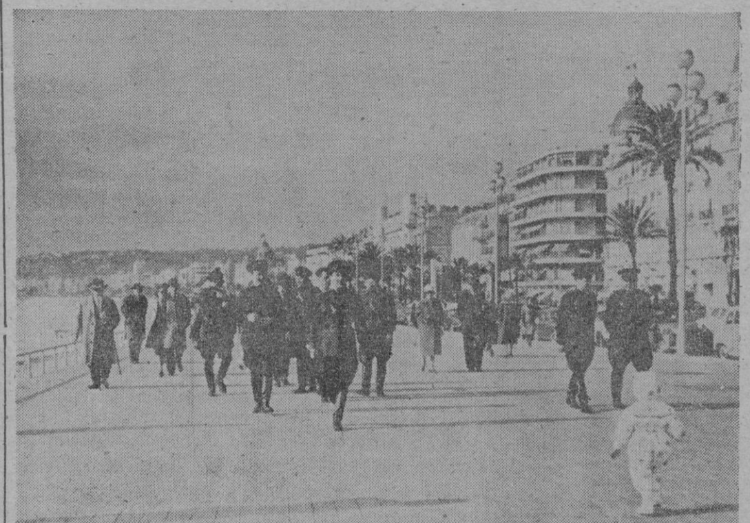
Por el Internacional paseo marítimo de Niza —que visto en el grabado recuerda en seguida el Paseo Marítimo de Palma— pasean, exhibiendo sus pesadas botas soldados del ejército soviético. La presencia de los rusos en una de las más bellas ciudades alzadas por el mundo occidental obedece a razones de índole artística: Son miembros de los coros del Ejército que van a participar en un festival de música. Puede ser verdad, pero... Pero ya se sabe que Rusia utiliza —o más bien, provoca— las ocasiones, culturales y artísticas para «ir a lo suyo» y «sacar tajadas». Y Occidente no debe ignorarlo, o fingir ignorarlo, en ningún momento. Y ese Occidente debe ser precavido para que esas pesadas botas soviéticas que ahora resuenan sobre el llo Paseo de los Ingleses con una apariencia pacífica, no puedan resonar en el futuro sobre las calles de todas las ciudades europeas anunciando la ocupación militar. Porque eso —no hace falta decirlo— significaría el final de nuestra civilización...