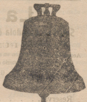
Todas mis campanas suenan la NOTA justa convenida construcción esmeradísima ya garantía 10 años. Se refunden las rotas á precios muy económicos, siendo de mi cuenta los portes de ferrocarril á toda España.

Única fábrica de su género en España, dotada de maquinaria de gran precisión y motores á vapor y eléctricos; se construyen relojes para iglesias, Casa consistoriales, colegios, cuarteles, etc., etc.