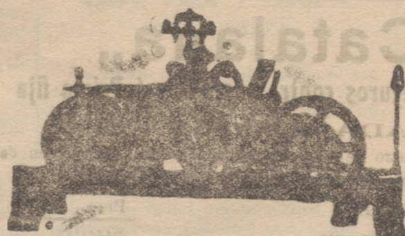
Reloj de ocho días de cuerda tocando horas con repetición y medias