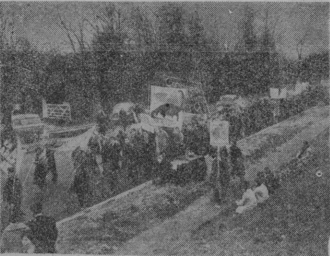
Como ya saben nuestros lectores por la crónica de nuestro corresponsal en Londres, durante tres días han caminado los manifestantes británicos que iniciaron una marcha en señal de protesta contra las explosiones y experimentos atómicos.