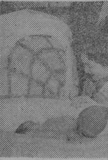
Esta es la primera fotografía oficial del pequeño príncipe Hiro Nahurito, hijo del príncipe heredero del Japón. Sus padres, el príncipe Akihito y la princesa Michiko, se inclinan con ternura sobre la cuna del bebé real.