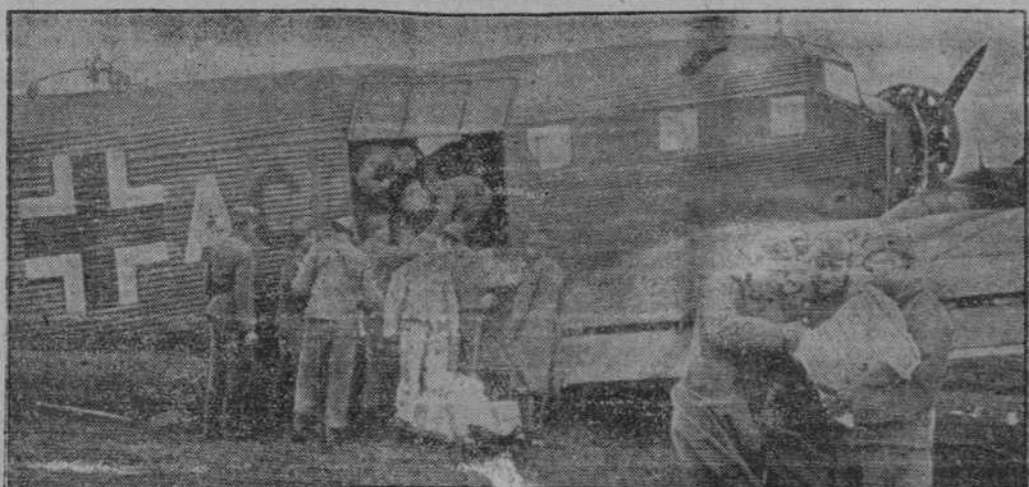
"El correo ha llegado". Es una de las exclamaciones más alegres del soldado en Rusia. Esta foto muestra la llegada del avión correo a un aeródromo de campaña alemán, de donde partirán rápidamente para las primeras líneas

Publicidad M. E. R. O. Anuncios para Prensa, Radio, Cines Para León y toda España