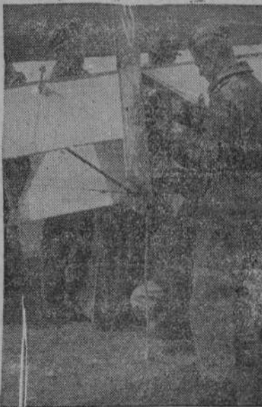
En numerosos lugares de Alemania hay escuelas con campos apropiados, de vuelos sin motor, donde se capacita la juventud que formará la futura aviación del Reich. En la foto vemos cómo preparan un avión a vela para un vuelo

Nuestro ministro y el primer representante diplomático en España de la nueva Croacia, sostuvieron una conversación muy cordial.—(Cifra).