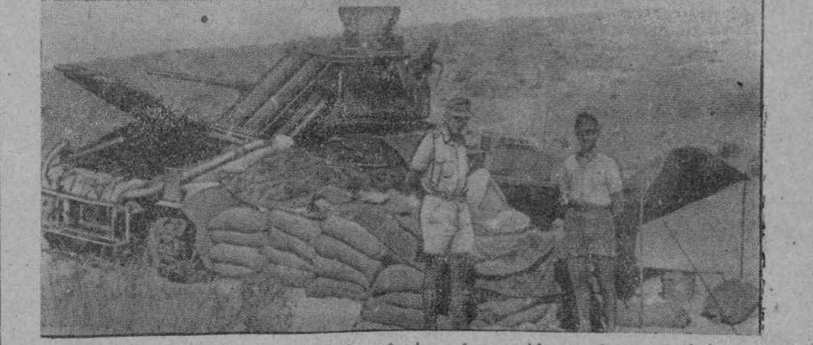
Este tanque inglés destruido, sirve de refugio a los soldados de un antiaéreo alemán en el desierto