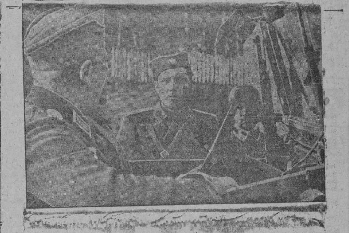
De las pasadas operaciones: Llegada del parlamentario ser vicio a las líneas alemanas para la capitulación de su ejército

Por la noche el embajador regresó a la capital del Reich.