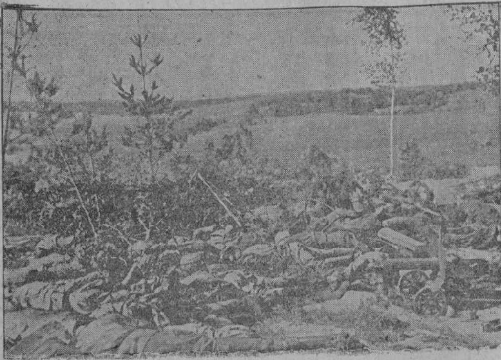
Soldados del ejército rojo caídos en los combates desarrollados en uno de los sectores de la línea Stalin