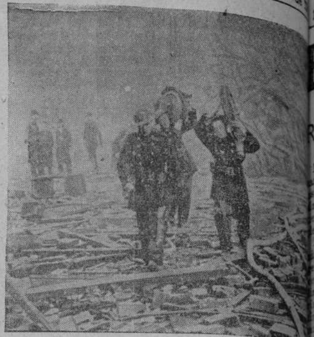
Aspecto de las instalaciones portuarias de Glasgow después de haber sido objeto de las bombas alemanas.

enorme altura. Los aparatos británicos han atacado también a la navegación enemiga en Dapedusa, alcanzando con las bombas que arrojaron a dos barcos enemigos de unas 300 toneladas cada uno. Otros aviones británicos han atacado a los aviones italianos del tipo “Savoia”, quedando destruido uno de los aviones italianos y sufriendo importantes averías otros muchos.—