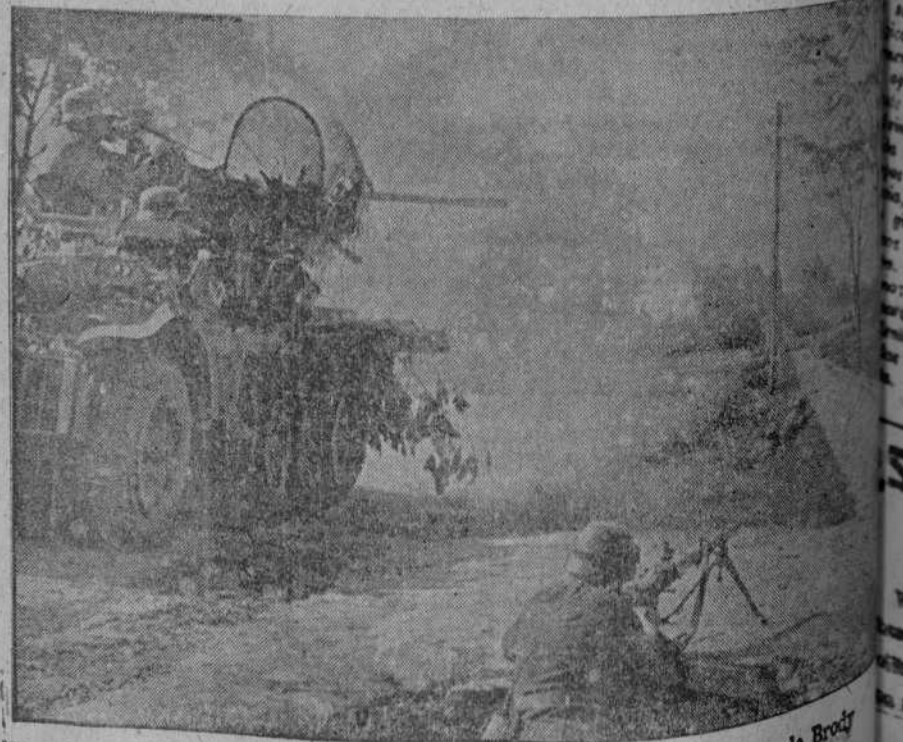
Artillería alemana rompiendo la resistencia soviética cerca de Brody

Empresa: Mejora el servicio sanitario de los hospitales con vuestra colaboración económica al "Frente de la Salud".