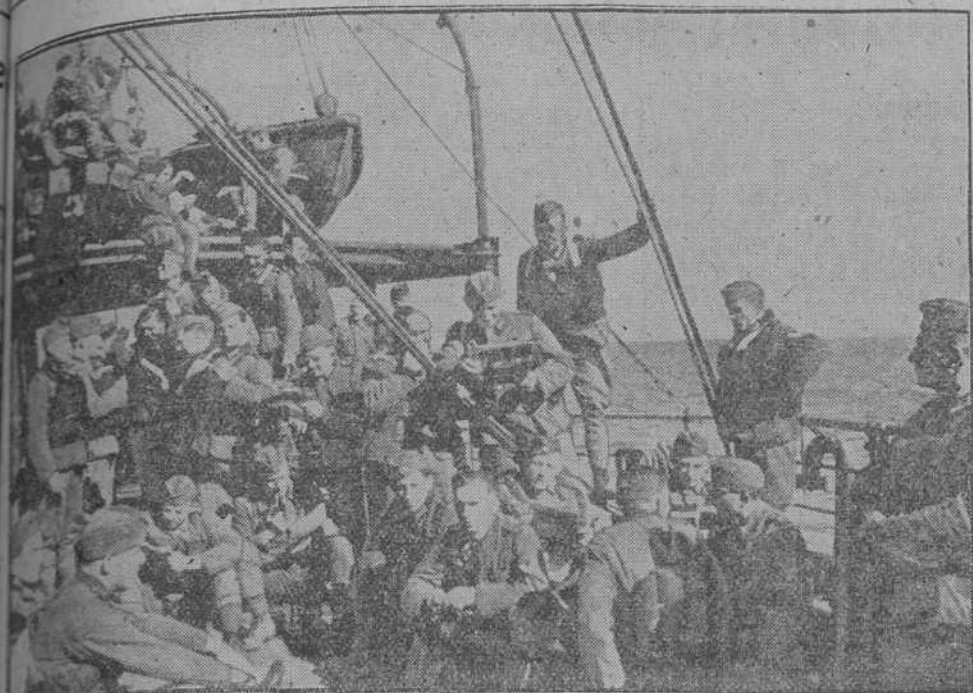
Refuerzos alemanes embarcan en Sicilia para Africa