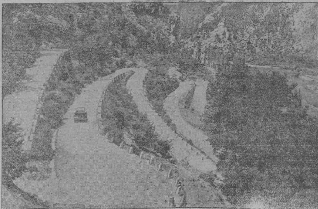
Típica carretera de la costa de Dalmacia, testigo de luchas guerreras en la guerra y victoriosa ofensiva del Eje

Abisinia.—Prosigue satisfactoriamente la reparación de los destrozos causados por el enemigo en las carreteras y nuestras tropas han podido acentuar su presión sobre las posiciones italianas de Amba Alagi. Además han ocupado las localidades de Bahrbar y Debub. En la región meridional continuaron brillantemente las operaciones".—EFE.