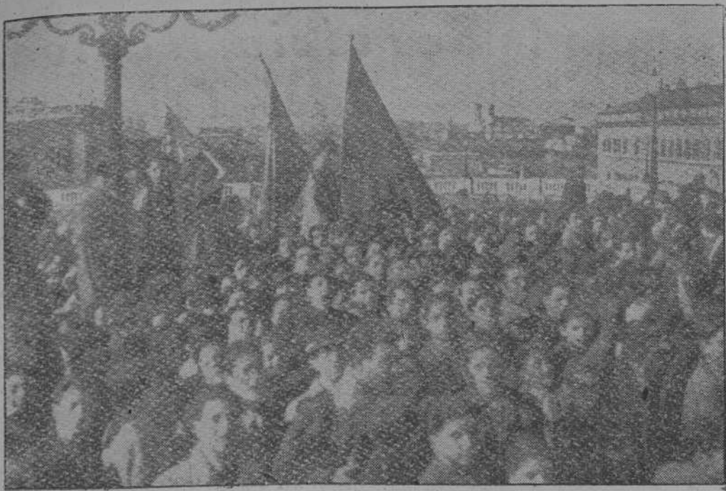
Los estudiantes de Roma protestaron en una imponente manifestación de las mentiras en las iglesias sobre supuestas desavenencias en el pueblo italiano.