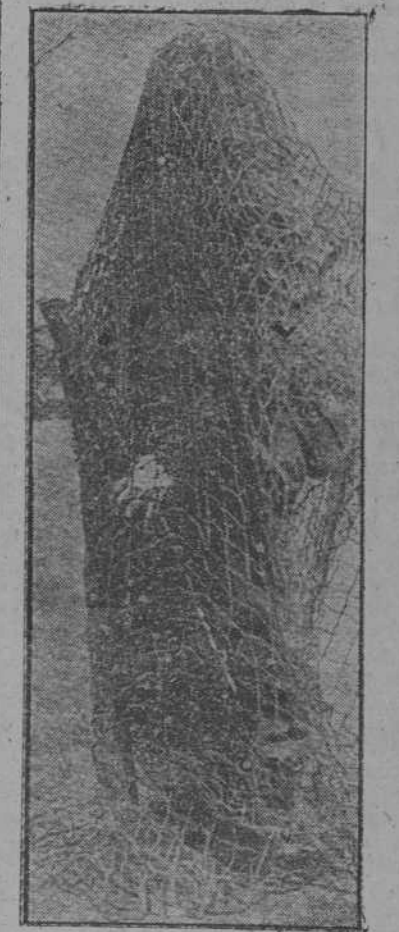
Un franco tirador inglés ostenta este curioso camuflaje, cuya utilidad parece muy relativa puesto que impide que el protegido pueda correr cuando el enemigo aparezca de veras.

Ginebra, 22.—Noticias de la prensa suiza confirman la obstrucción del Canal de Suez por dos barcos que hundió la aviación alemana. Han resultado infructuosos los esfuerzos realizados para dejar expedita la vía marítima.—Efe.