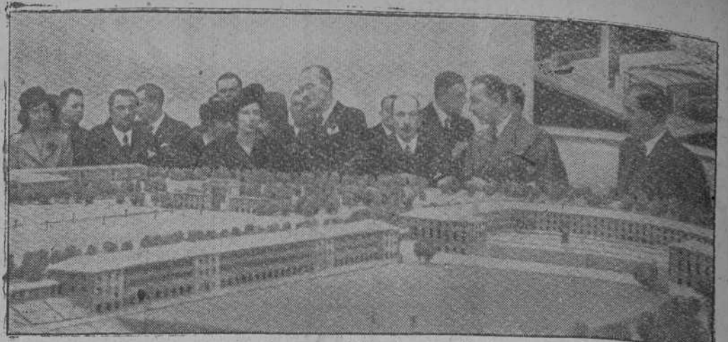
Los Reyes de Bulgaria visitando la Exposición de Arquitectura alemana inaugurada hace poco en Sofía

"ALERTA" de Santander, cuyos servicios y talleres han quedado completamente reducidos a cenizas, ruega a sus suscriptores le remitan a la mayor brevedad nota escrita de las señas a que ha de enviarse el periódico que ya se publica normalmente y que recibirán tan pronto como se hayan recibido las antedichas direcciones. Domicilio provisional: Pedruca, 9, 1.º. Apartado 20, Santander.