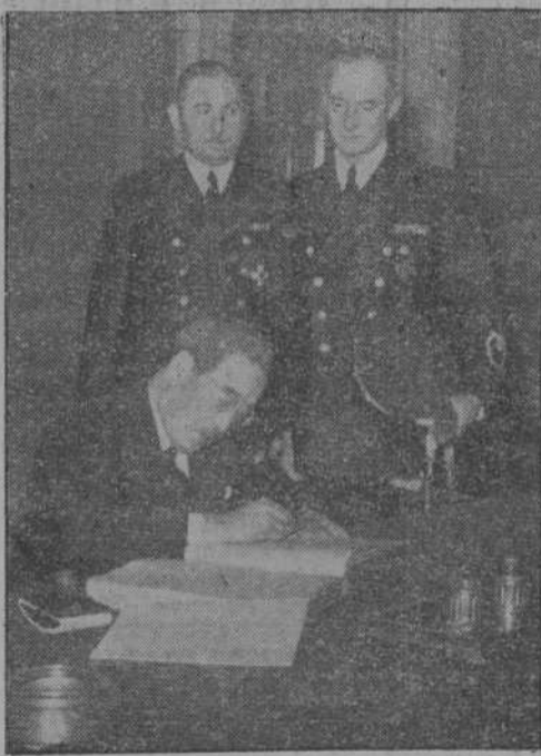
El Embajador del Japón, Kurusu, se inscribe en el libro de felicitaciones, en la Cancillería del Reich

Buenos Aires, 22.—"Associated Press" comunica desde Londres que los Estados Unidos e Inglaterra se proponen comprar toda la producción de lana argentina, mientras dure la guerra, con el fin de impedir la adquisición de dicho producto por Alemania.—EFE.