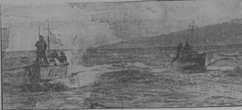
Para la vigilancia de las costas italianas se emplean ahora pequeñas lanchas rápidas cuya construcción especial excluye todo peligro de hundirse