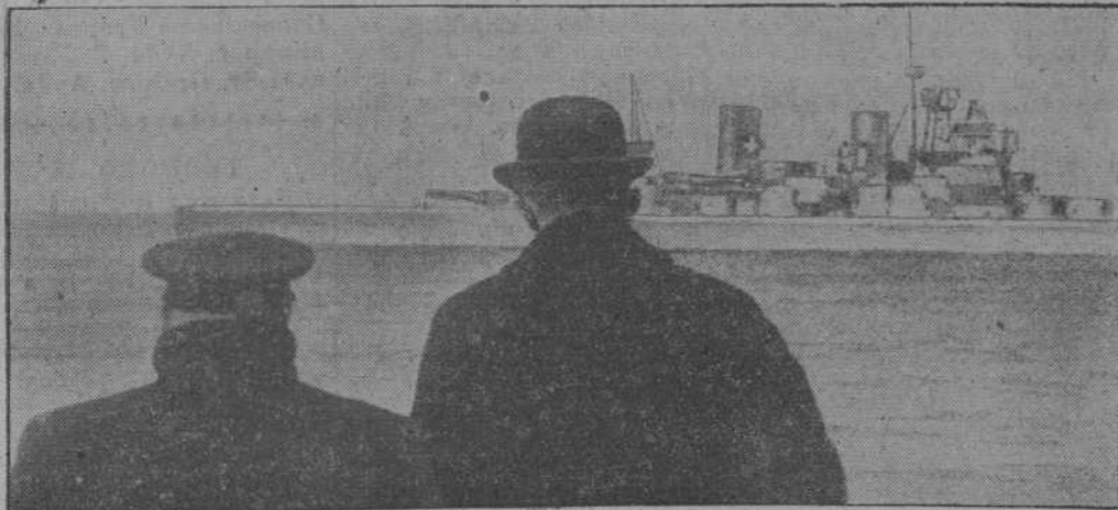
Churchill y Halifax dirigiéndose al acorazado que llevó al nuevo embajador inglés a los Estados Unidos en busca de ayuda para el requebrado imperio británico

Por último se acordó excluir del comité central del partido a ciertas personalidades, entre ellas, como se había anunciado, a Litvinoff, por falta de celo en el cumplimiento de su misión, y dirigir advertencias a varios comisarios del pueblo por el mismo motivo.—EFE.