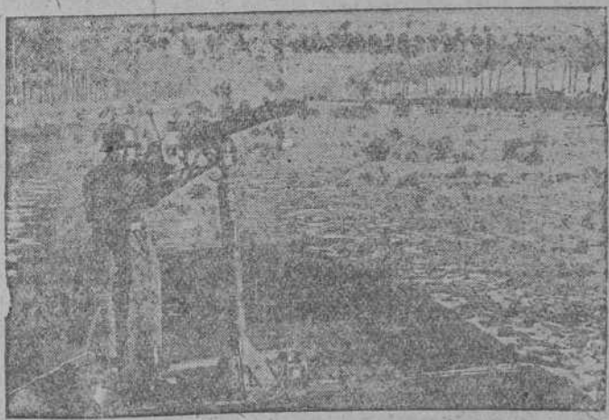
LOS GRANDES CANALES DE FLANDES ESTAN PROTEGIDOS POR ANTIAEROS LIGEROS MONTADOS EN LAS BARCAS RAPIDAS