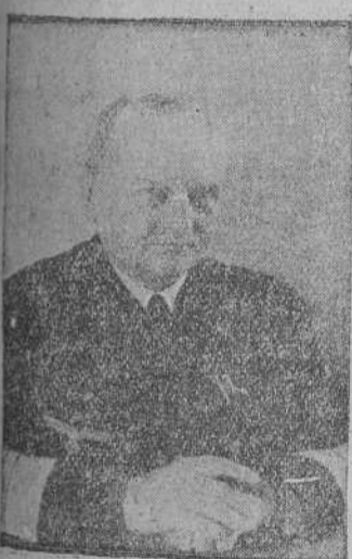
El Almirante alemán, Stalwacher, cuyo nombre está ineludiblemente ligado con las grandes campañas en el Mar del Norte.

Padre Isla, 3.—León.—Teléfono 12-17. Azulejos blancos y color. Mosaicos. Baldosín italiano. Coccinas Sagardui. Todo lo concerniente a saneamiento y materiales de construcción.