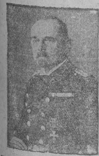
El Almirante a'mán, Cr., cuyo nombre apareció en la prensa mundial con motivo de las campañas en el Mar del Norte.