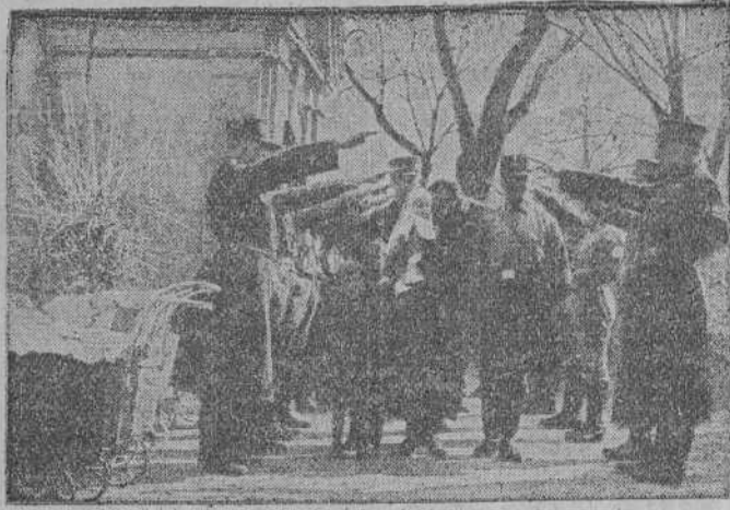
Después del bautizo eclesiástico, los camaradas alemanes de la milicia parda expresan formados sus votos y felicitación.