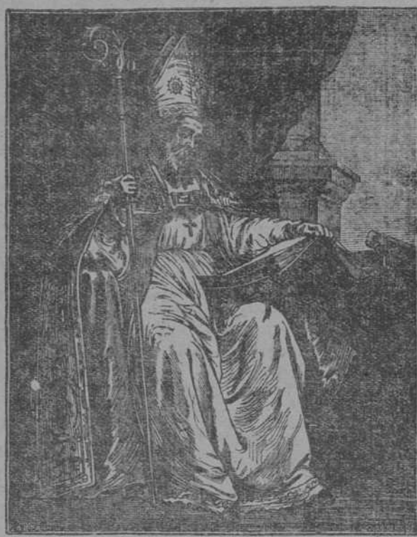
San Isidoro, arzobispo de Sevilla, según el cuadro de Murillo existente en el Palacio Arzobispal de la capital andaluza.

Hoy se celebra en León la fiesta de este santo, Patrón de nuestro antiguo reino leonés, fiesta conocida popularmente con el nombre de "Las Cabezas". FLOA, respetuoso con las tradiciones leonesas y amante de las glorias patrias como San Isidoro, una de las estrellas, máximas en el cielo de la Historia de España, rinde su modesto tributo de homenaje al santo y sabio glorioso y le pide fervorosa y humildemente que siga protegiendo a su amado pueblo leonés, para que crezca en la fe y en todas las virtudes.