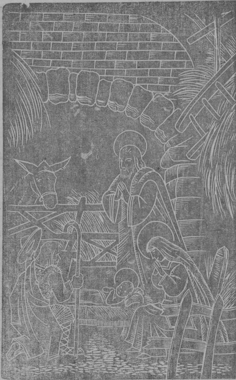
¡NACE EL SEÑOR!