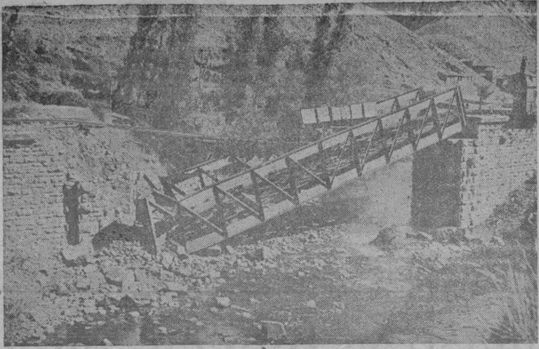
LA HUELLA MARXISTA.—Entre Santa Lucía y Villamanín, calvario de ruinas y desolación, dejaron los rojos esta obra de ingeniería deshecha, en el ferrocarril del Norte, como una muestra más de su cultura...