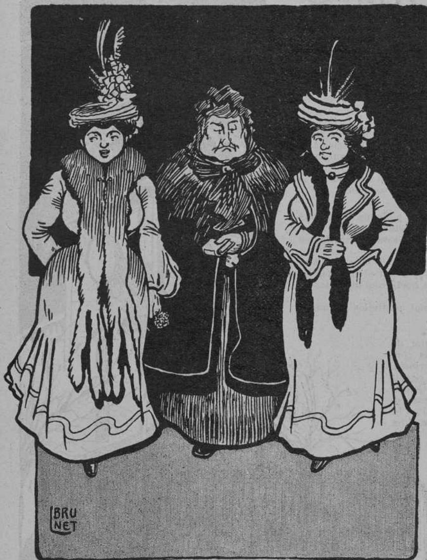
Per Sant Joseph, matóns.