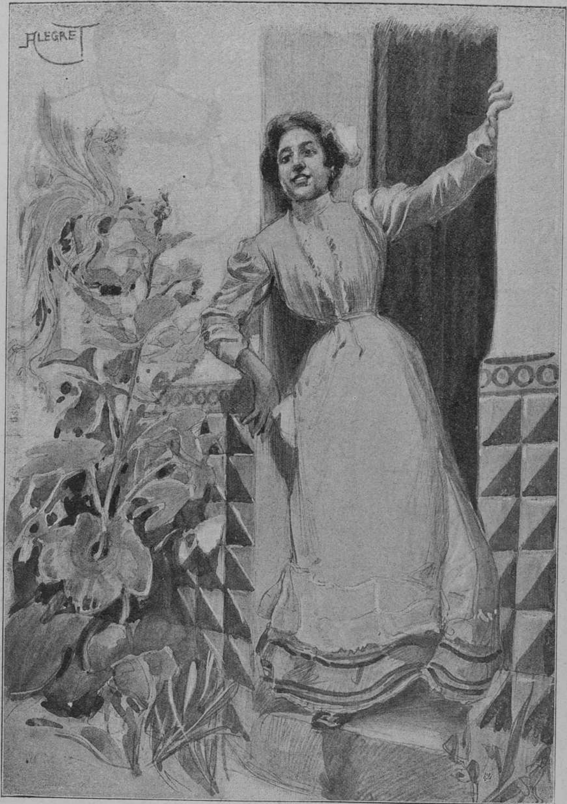
—En un sol mes, dugas alegrías: el triunfo electoral dels meus y l' arribada de la Primavera.