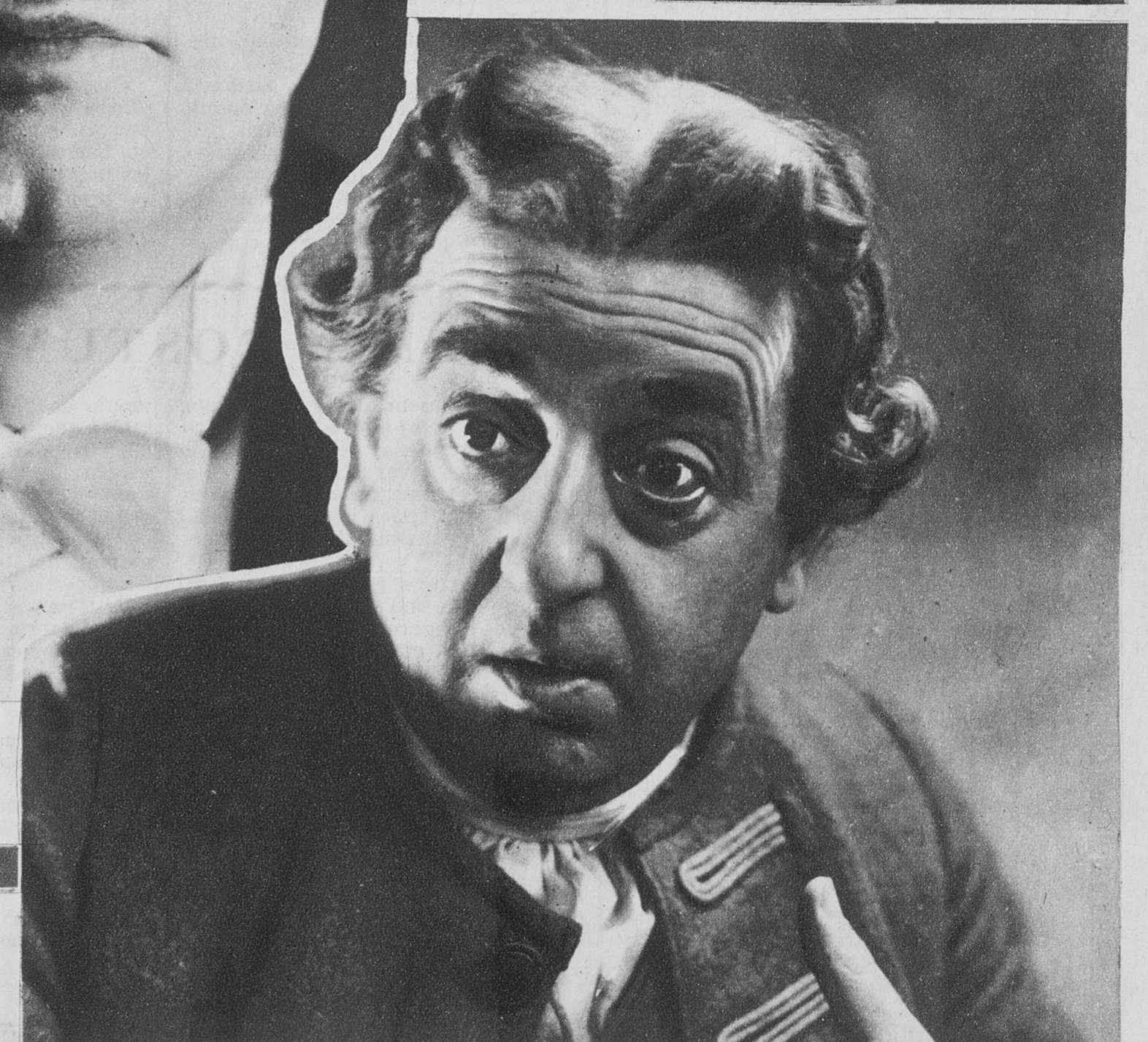
Lucien Baroux, el más popular de los actores cómicos del lienzo francés, en una escena de la película U. F. A. «Noche de Mayo» →