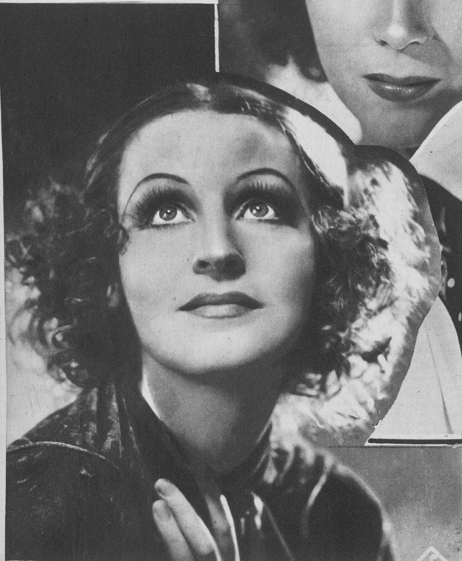
Brigitte Helm, la estilizada estrella, protagonista de la mayor parte de los films futuristas que ha realizado ← la U. F. A.