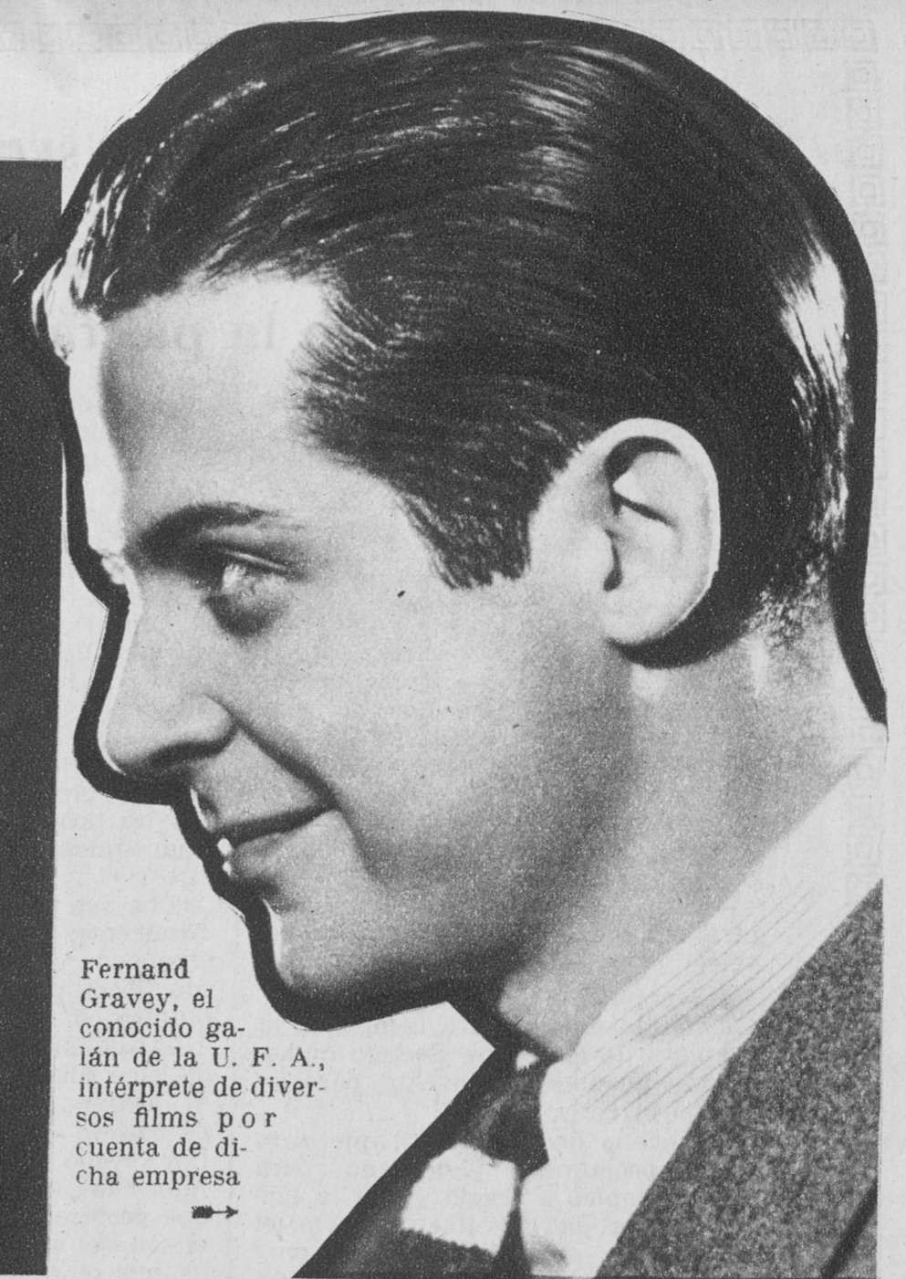
Fernand Gravey, el conocido galán de la U. F. A., intérprete de diversos films por cuenta de dicha empresa →