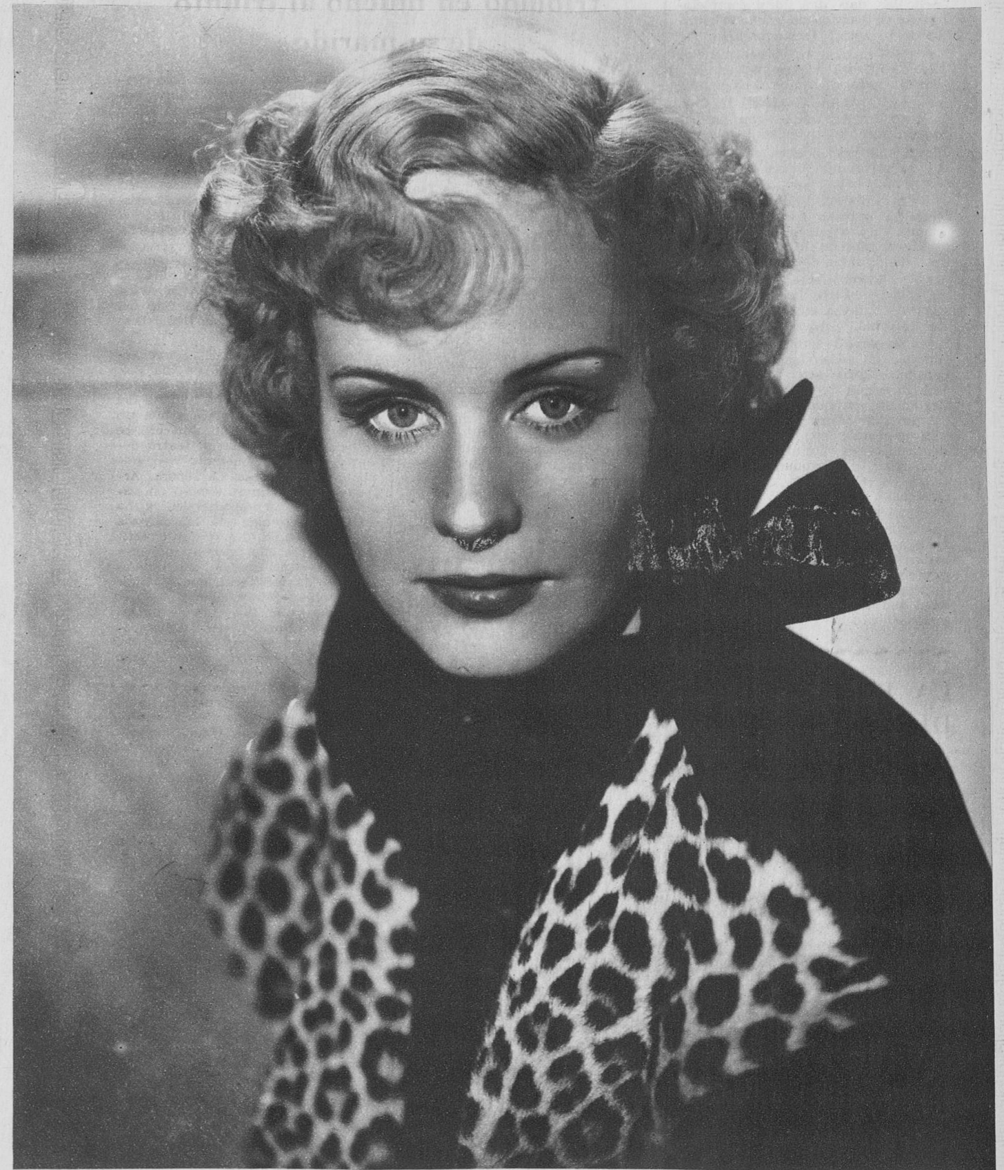
Madge Evans, la deliciosa estrella de la Metro Goldwyn Mayer, es una belleza rubia, delicada y sutil