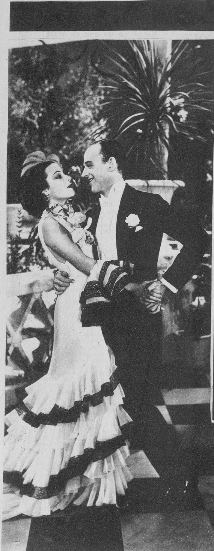
La Carioca, danza ultramoderna, una deliciosa mezcla entre rumba y machicha, la bailan Dolores del Río y Fred Astaire en esta escena del film «Volando hacia Río Janeiro»