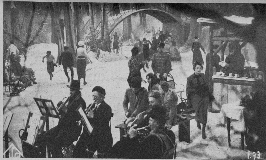
Pintoresco y bellissimo cuadro del nuevo film de la Ufa, «La princesa de las Czaras»