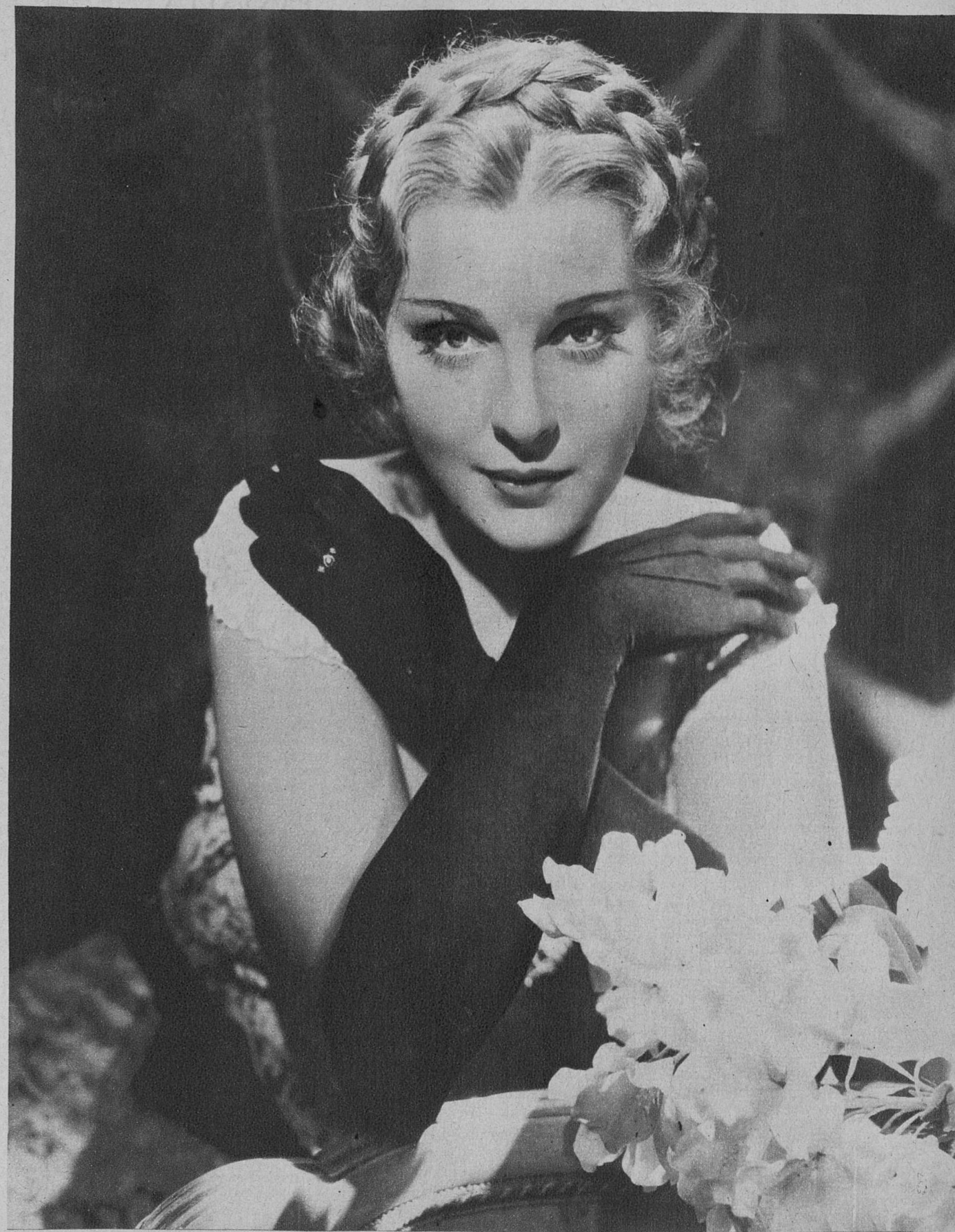
Anna Sten, Bellísima y famosa estrella de los «Artistas Asociados»