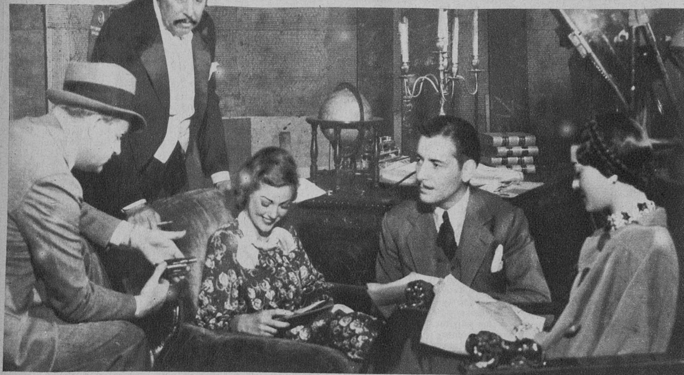
Durante la filmación de la nueva película «Bulldog Drummond se vengará»—que distribuirá los «Artistas Asociados», y en un breve descanso, Roy del Ruth, Warner Oland, Loretta Young, Ronald Colman y Kathleen Burke, abren un paréntesis a su labor y comentan los puntos más interesantes del film