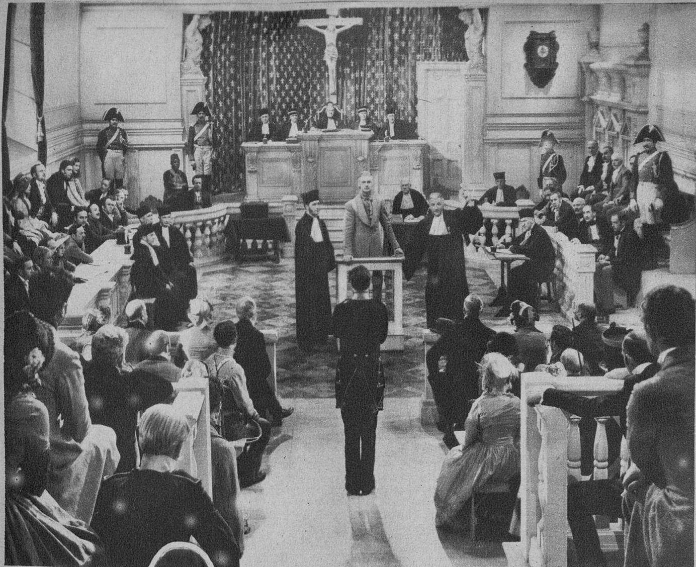
Uno de los más emocionantes cuadros de la película «El conde de Montecristo»