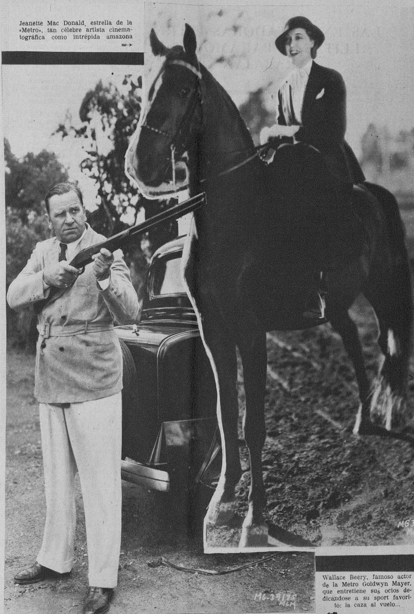
Wallace Beery, famoso actor de la Metro Goldwyn Mayer, que entretiene sus ocios dedicándose a su sport favorito: la caza al vuelo...

Jeanette Mac Donald, estrella de la «Metro», tan célebre artista cinematográfica como intrépida amazona