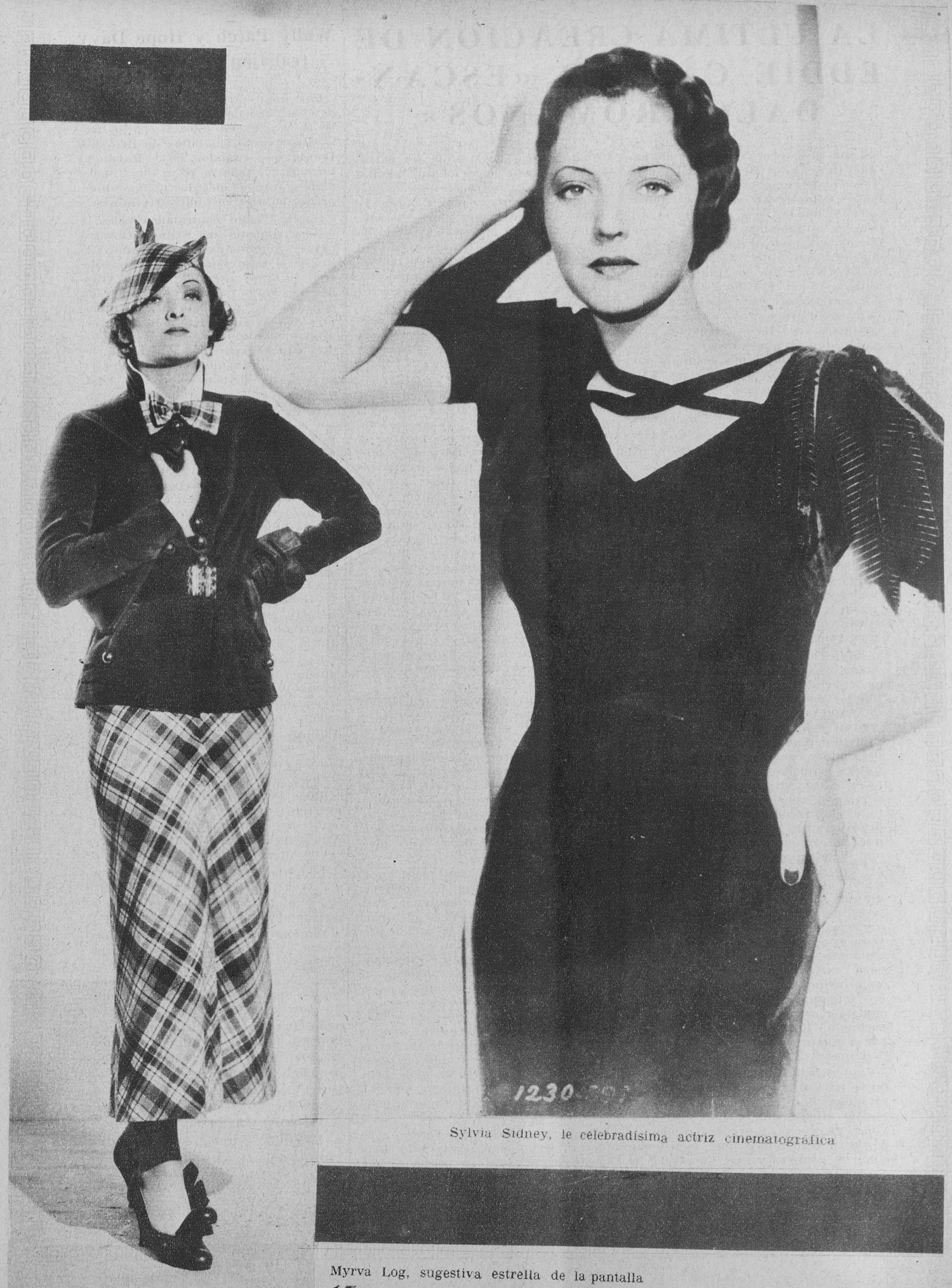
Sylvia Sydney, la celebradísima actriz cinematográfica