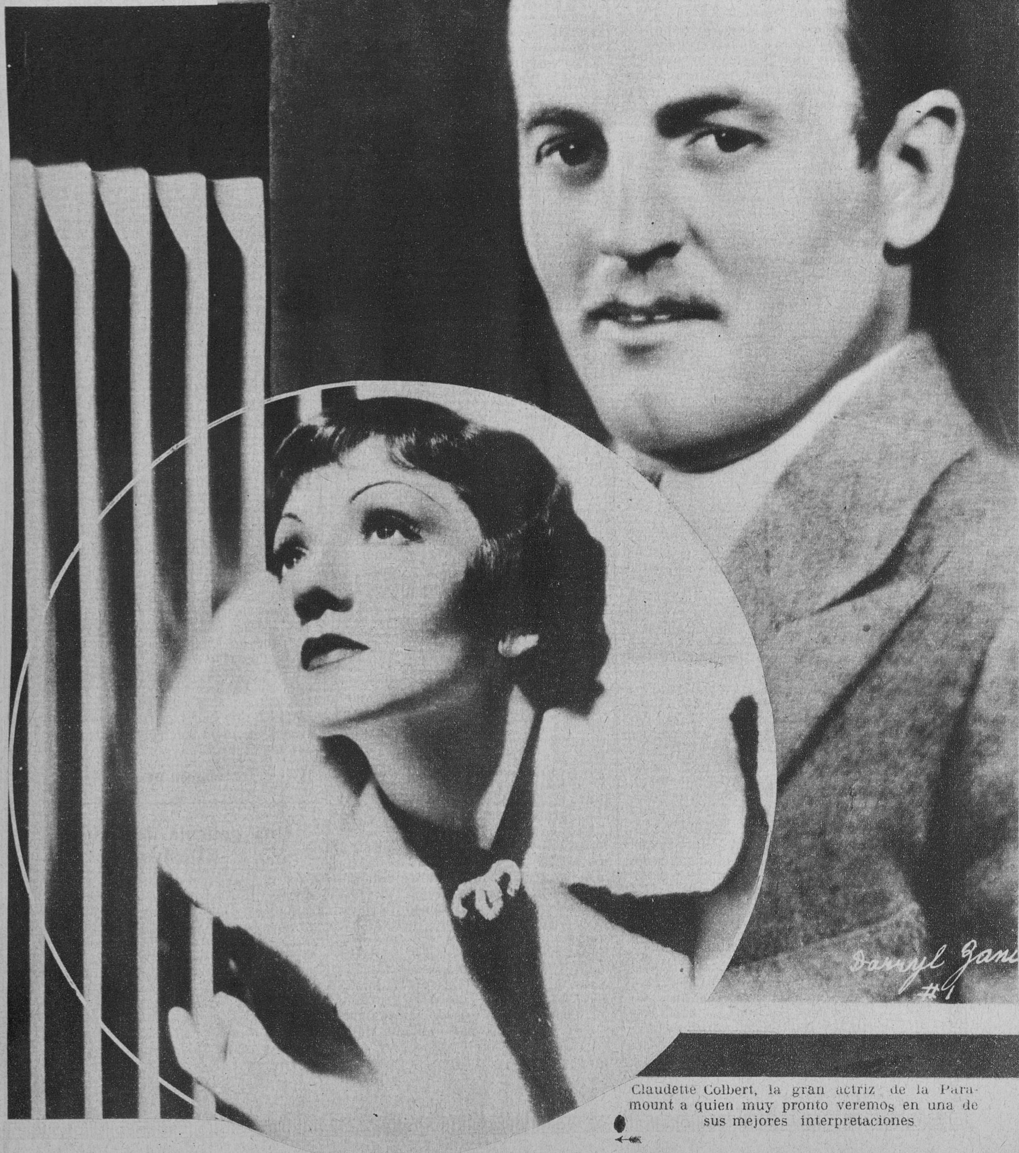
Claudette Colbert, la gran actriz de la Para- mount a quien muy pronto veremos en una de sus mejores interpretaciones