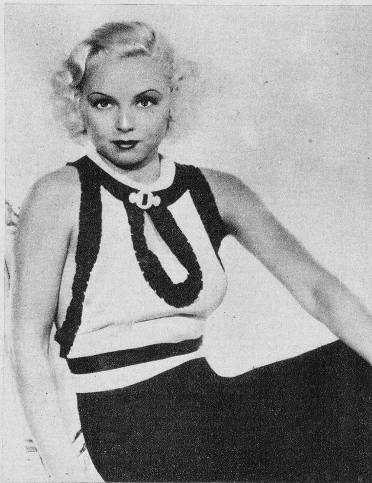
Foly Wing, la sugestiva rubia platino de la Paramount