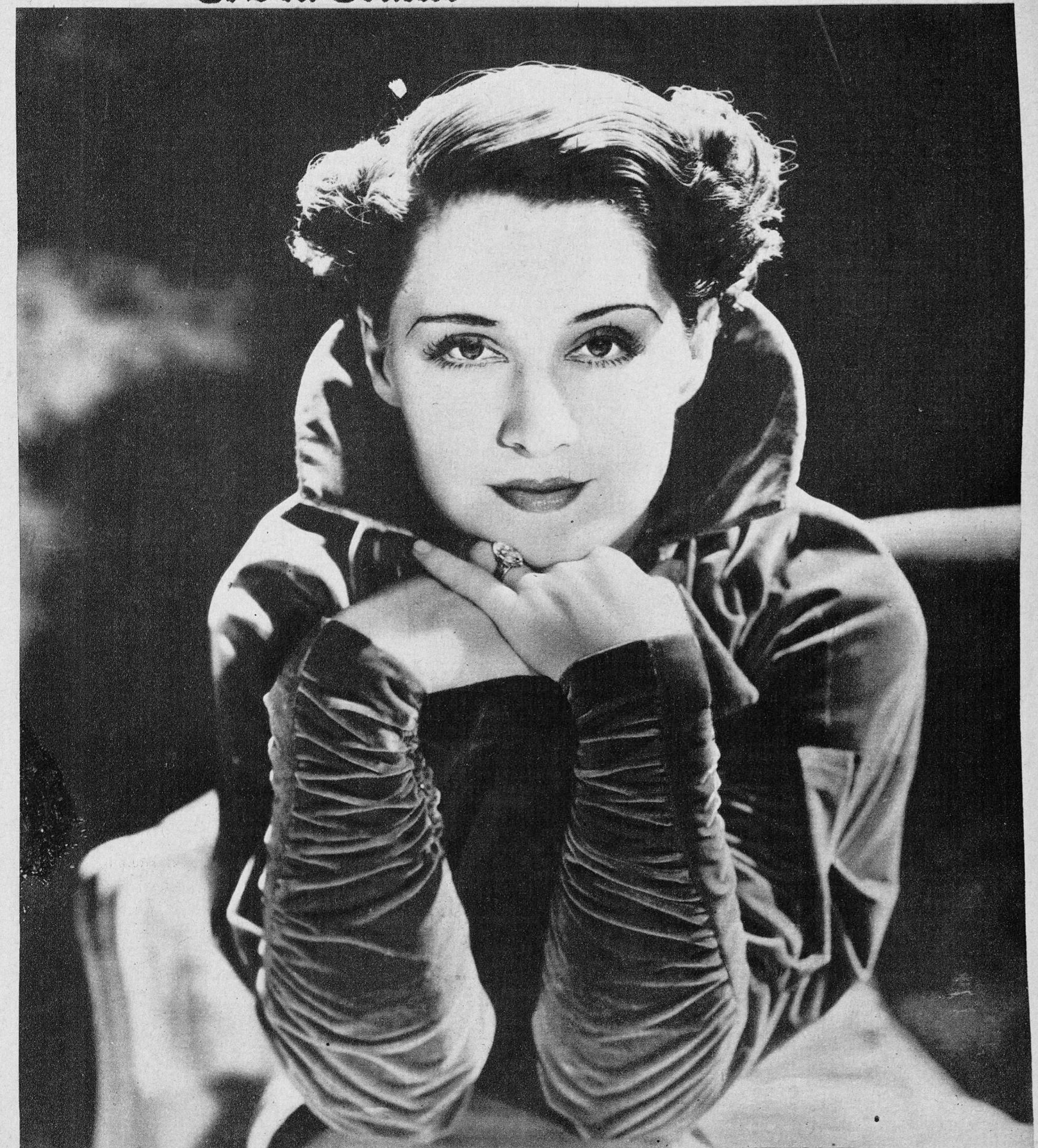
Norma Shearer, bella y sugestiva estrella de la Metro