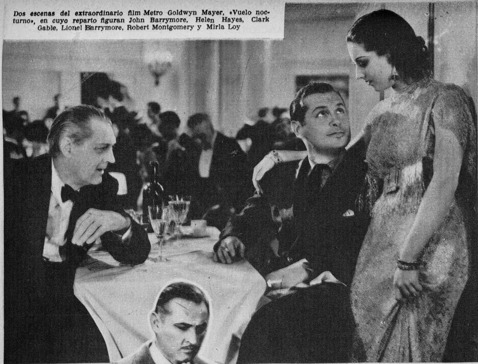
Dos escenas del extraordinario film Metro Goldwyn Mayer, «Vuelo nocturno», en cuyo reparto figuran John Barrymore, Helen Hayes, Clark Gable, Lionel Barrymore, Robert Montgomery y Mirla Loy