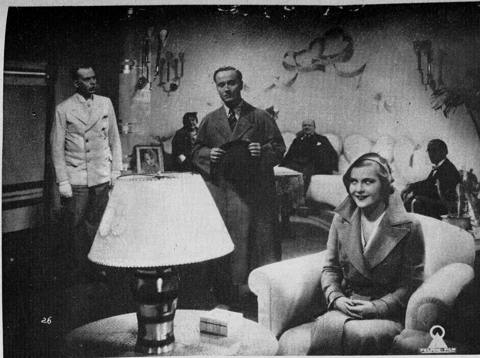
Una escena de la preciosa película de «Selecciones Capitolio», «¡A casarse, muchachas», creación insuperable de Renata Müller