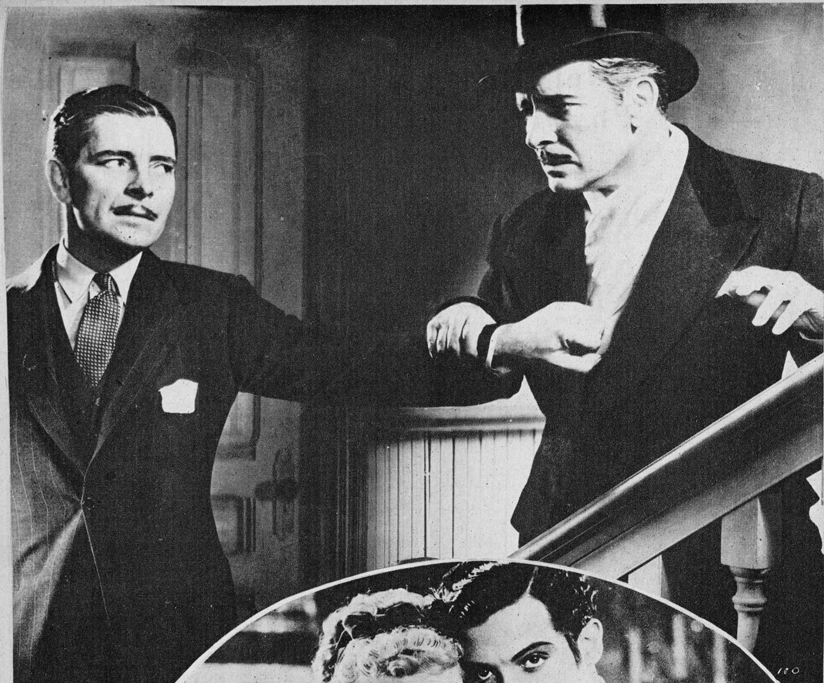
Ronald Colman, interpreta en el film «Las apariencias engañan», de los Artistas Asociados, un doble papel, como puede apreciarse por la fotografía