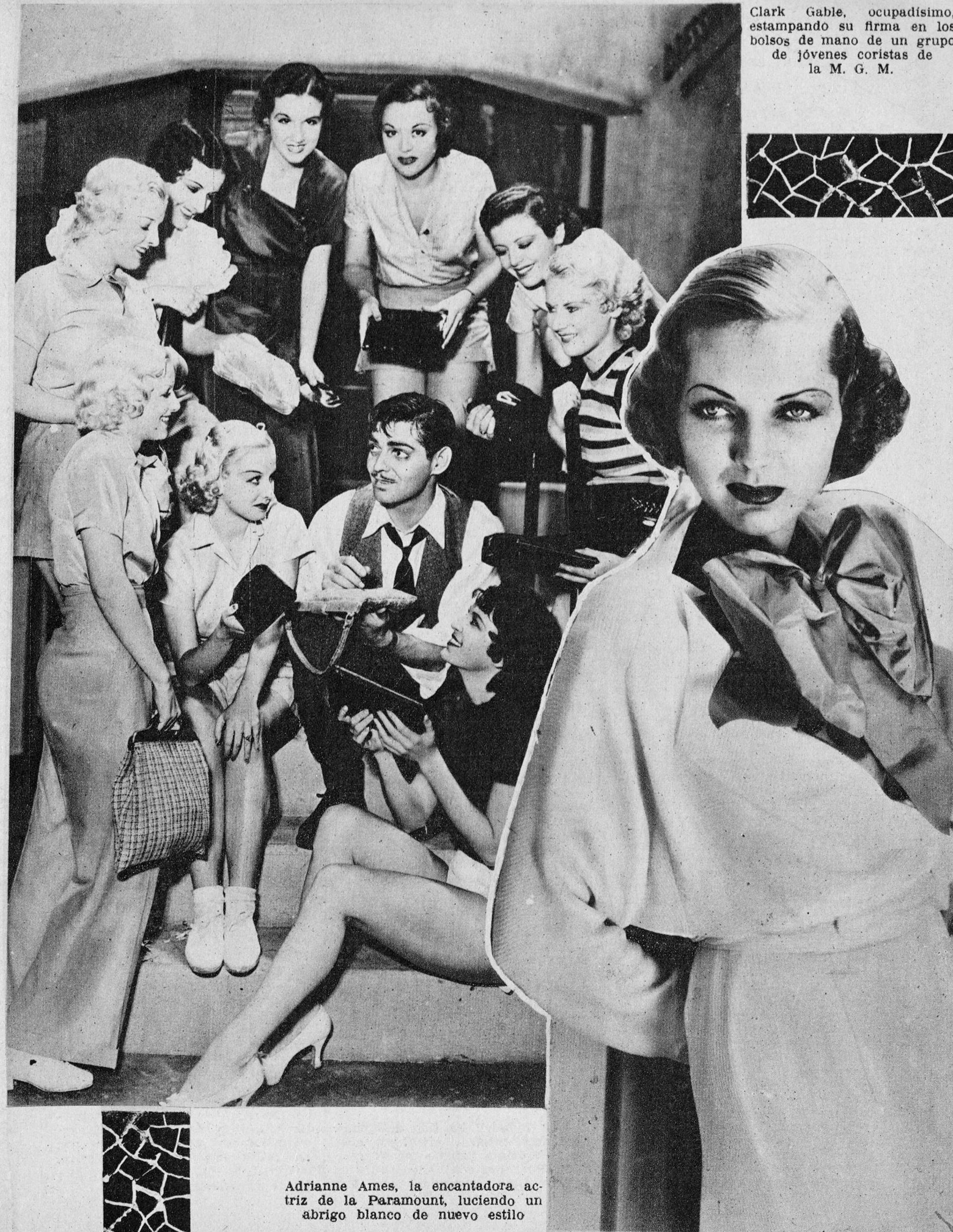
Clark Gable, ocupadísimo, estampando su firma en los bolsos de mano de un grupo de jóvenes coristas de la M. G. M.