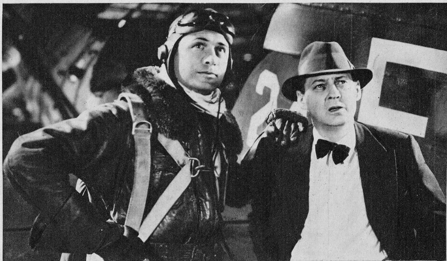
Dos interesantísimas escenas del film de la M. G. M., «Vuelo nocturno», en el que figuran como principales intérpretes Helen Hayes, John Barrymore, Clark Gable, Robert Montgomery y Myrna Loy