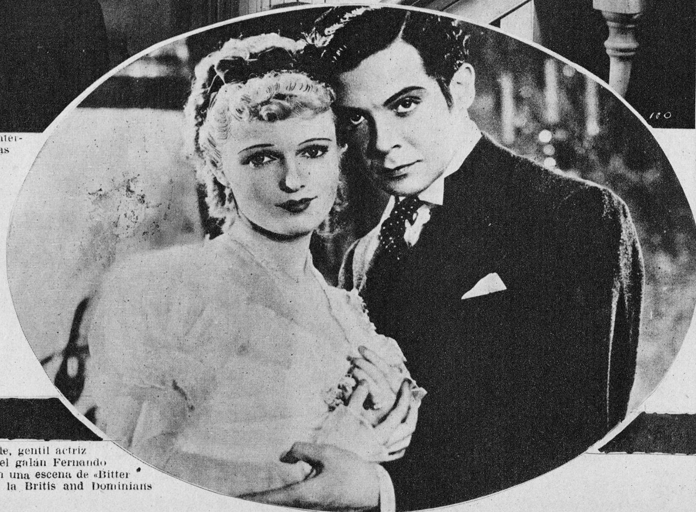
Anna Neagle, gentil actriz inglesa, y el galán Fernando Graavey, en una escena de «Bitter Sweet», de la Britis and Dominians