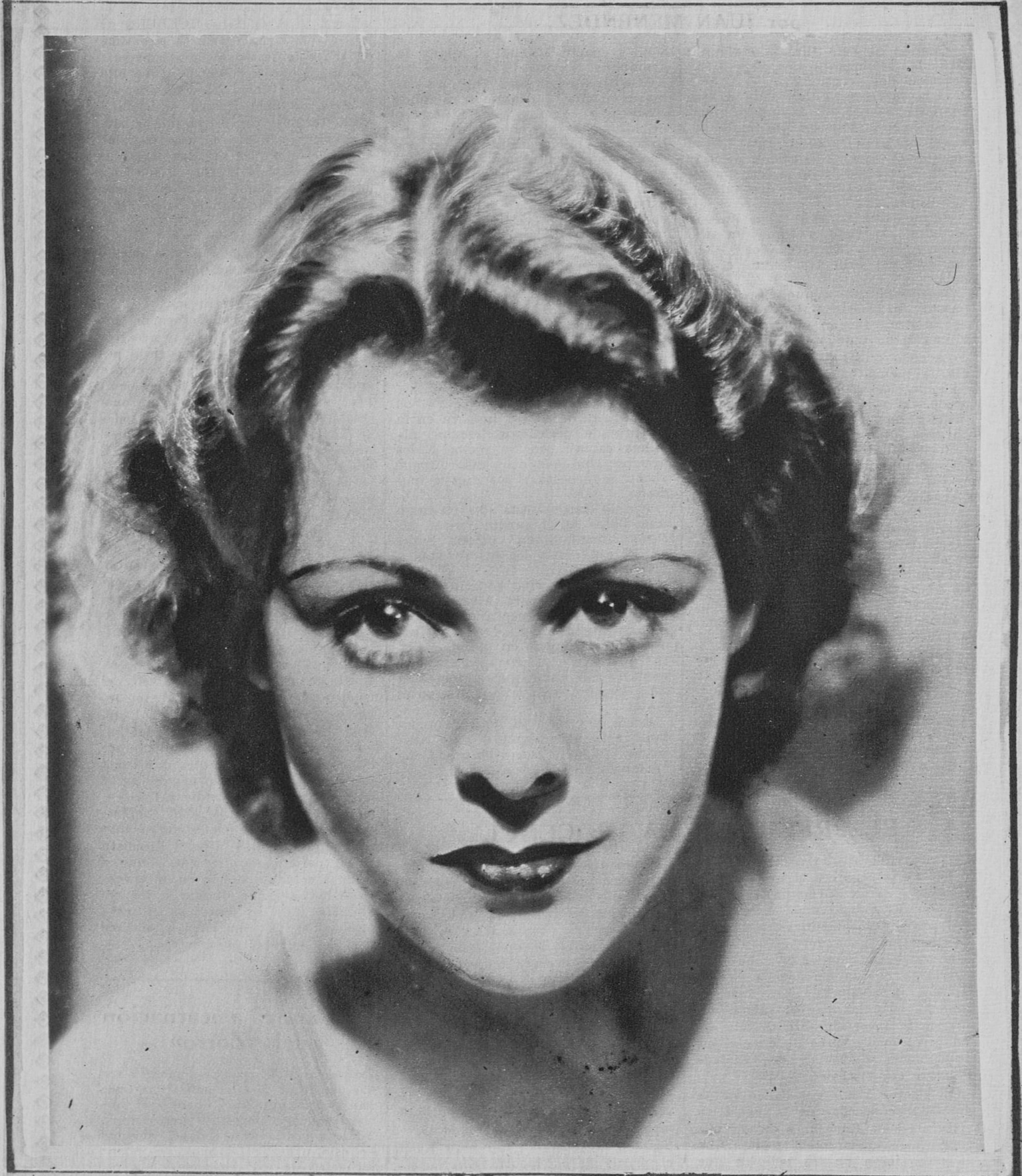
FRANCES DEE La excelente y bellísima actriz de la Paramount, intérprete magnífica de tantos buenos films.