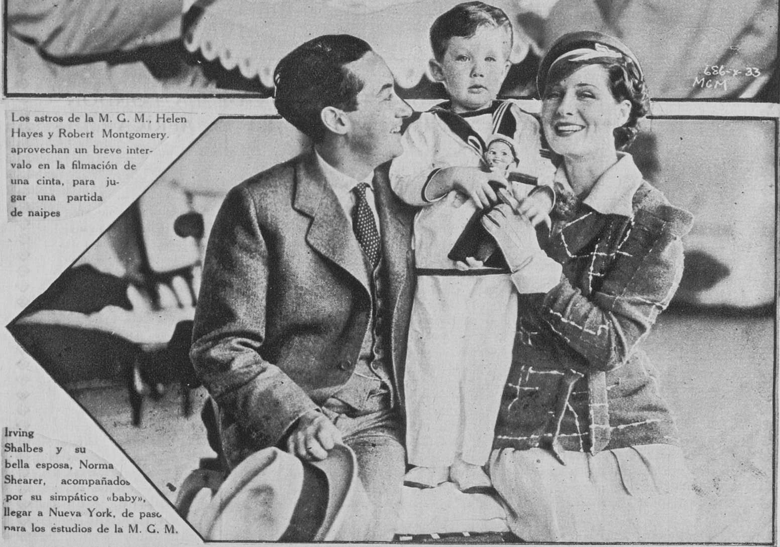
Irving Shalbes y su bella esposa, Norma Shearer, acompañados por su simpático «baby», llegar a Nueva York, de paso para los estudios de la M. G. M.