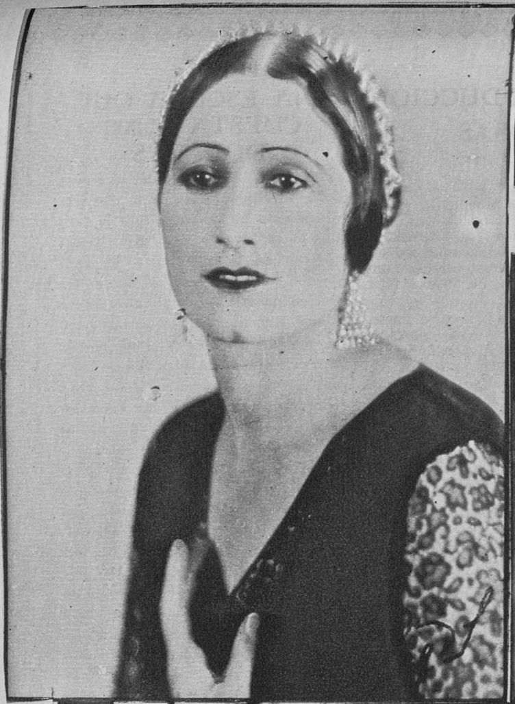
Marina Torres, excelente artista española, que en breve admiraremos en varios films de producción nacional