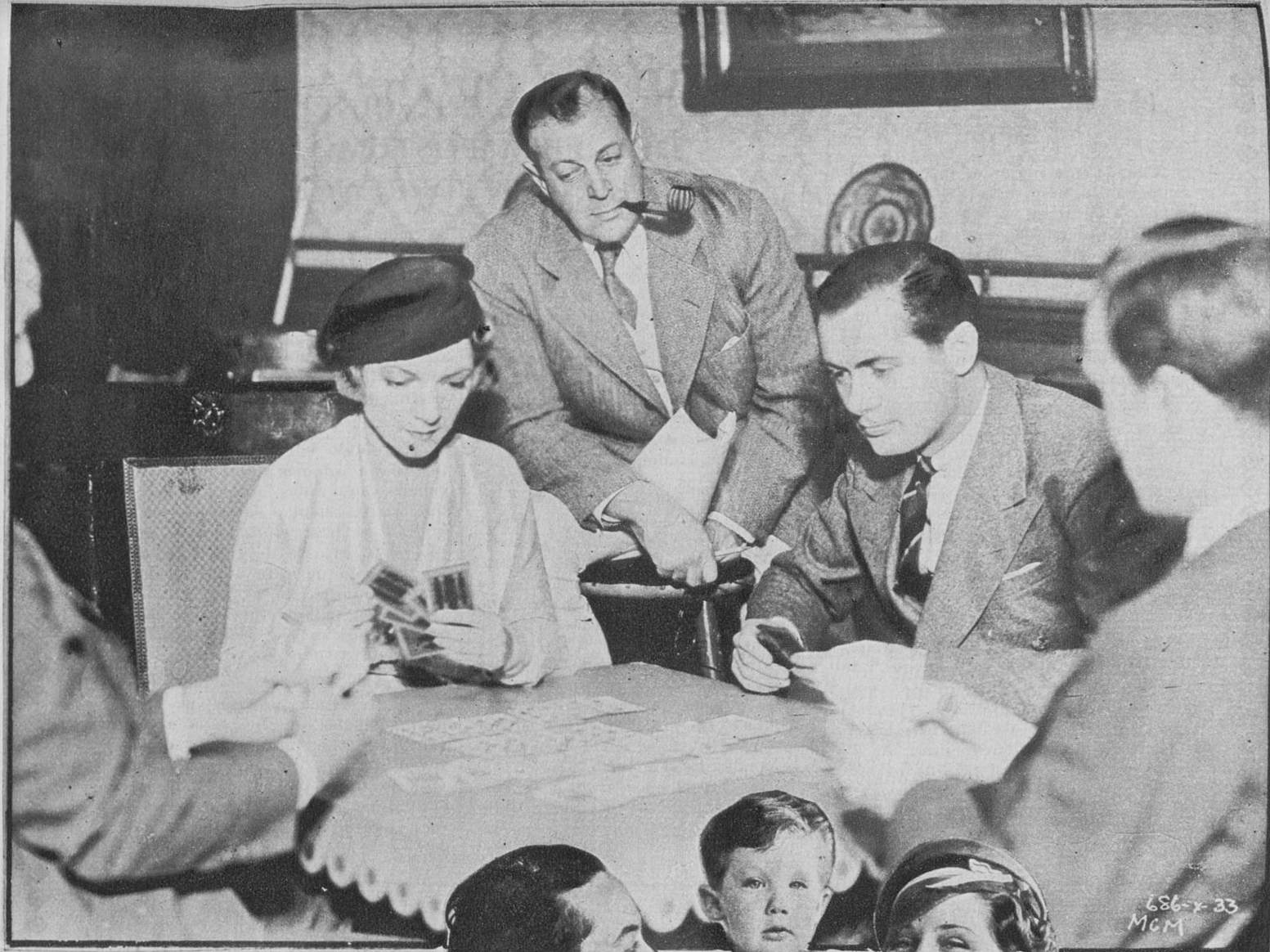
Los astros de la M. G. M., Helen Hayes y Robert Montgomery, aprovechan un breve intervalo en la filmación de una cinta, para jugar una partida de naipes