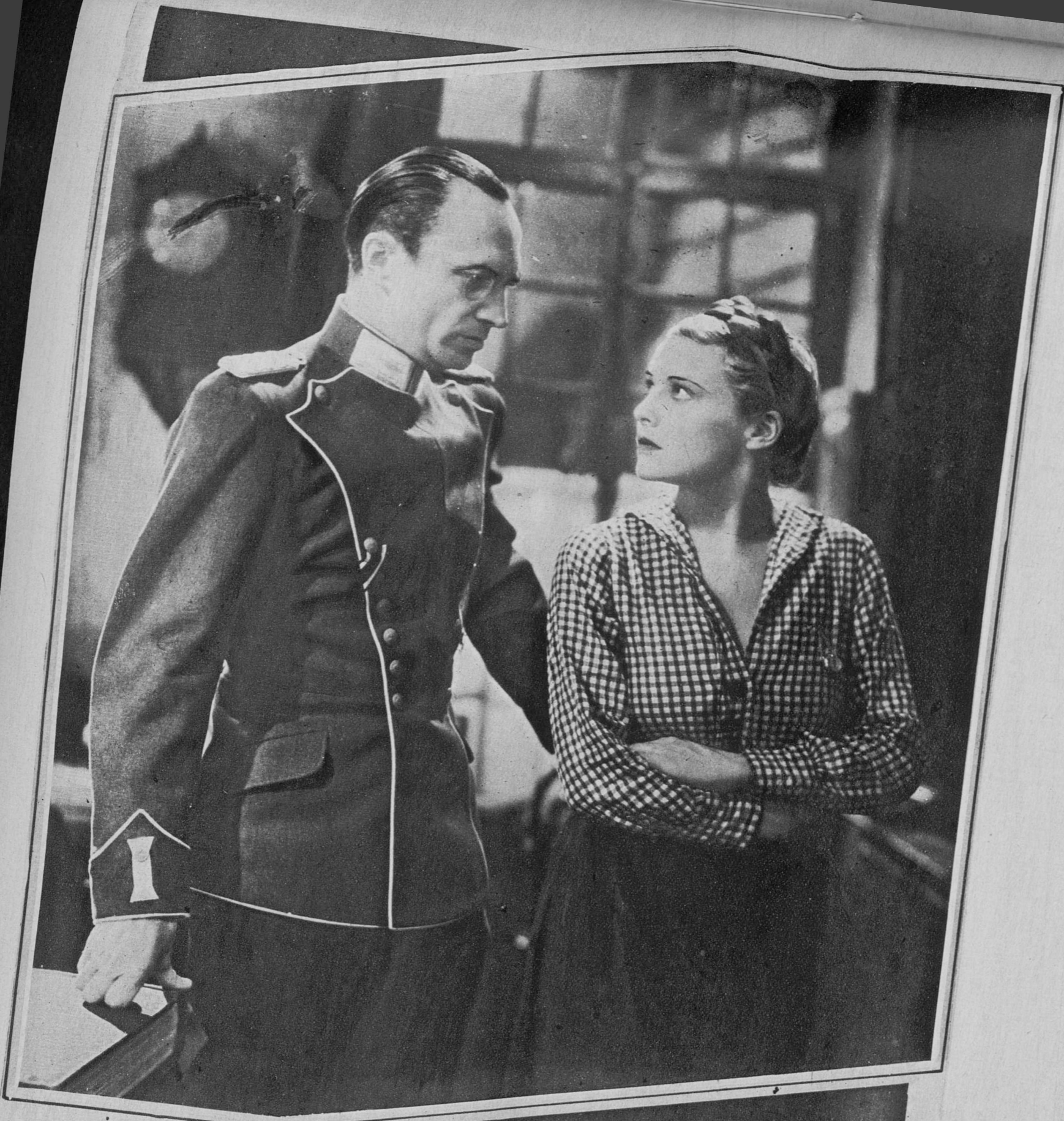
Madeleine Carroll y Conrad Veidt, en una escena del film «Yo he sido espía», que acaba de rodarse en los estudios de la Gaumont-British