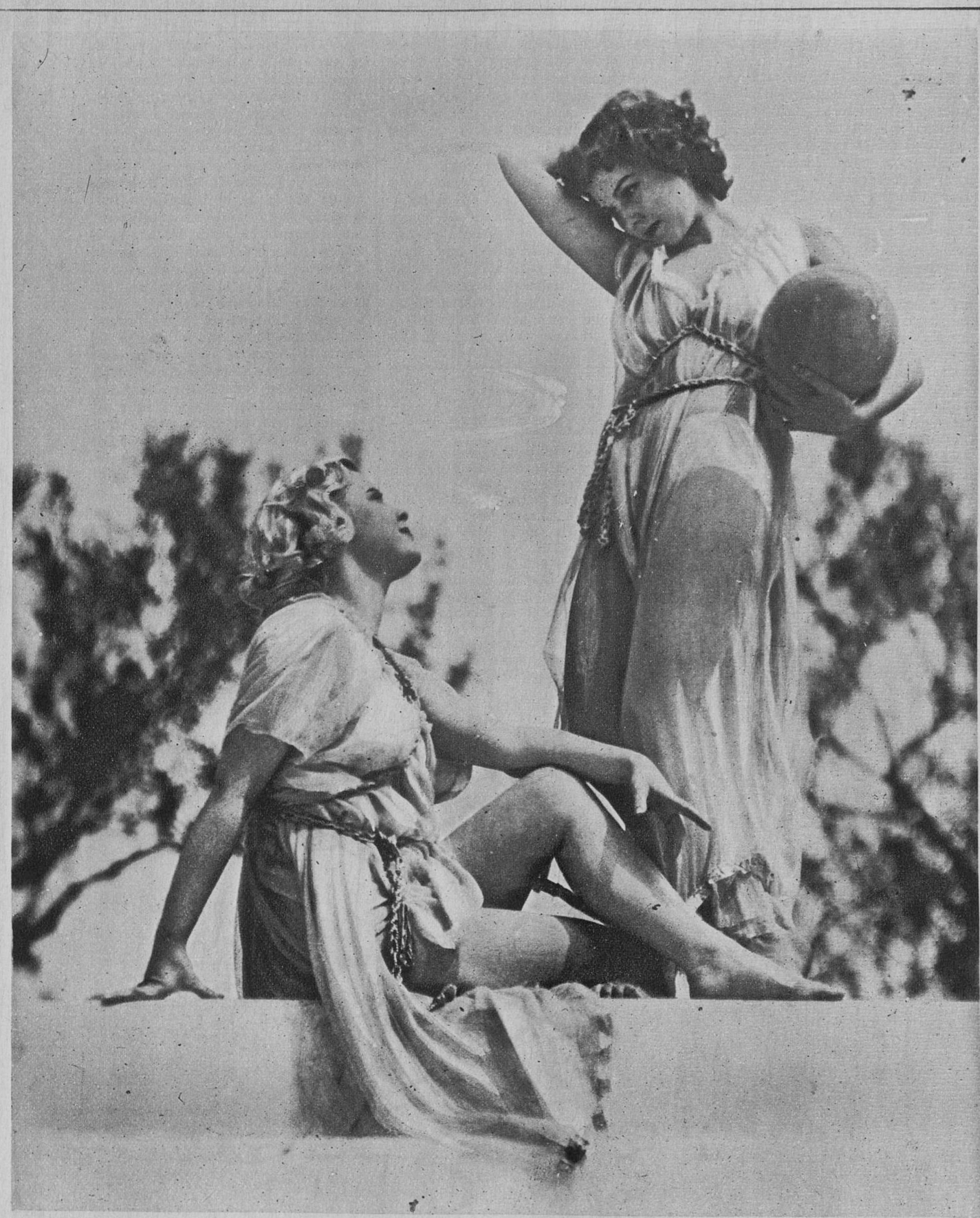
Interesante y artístico estudio fotográfico de JEAN PARKER y MARY CARLISLE, bellísimas «stars» de la Metro Goldwyn Mayer