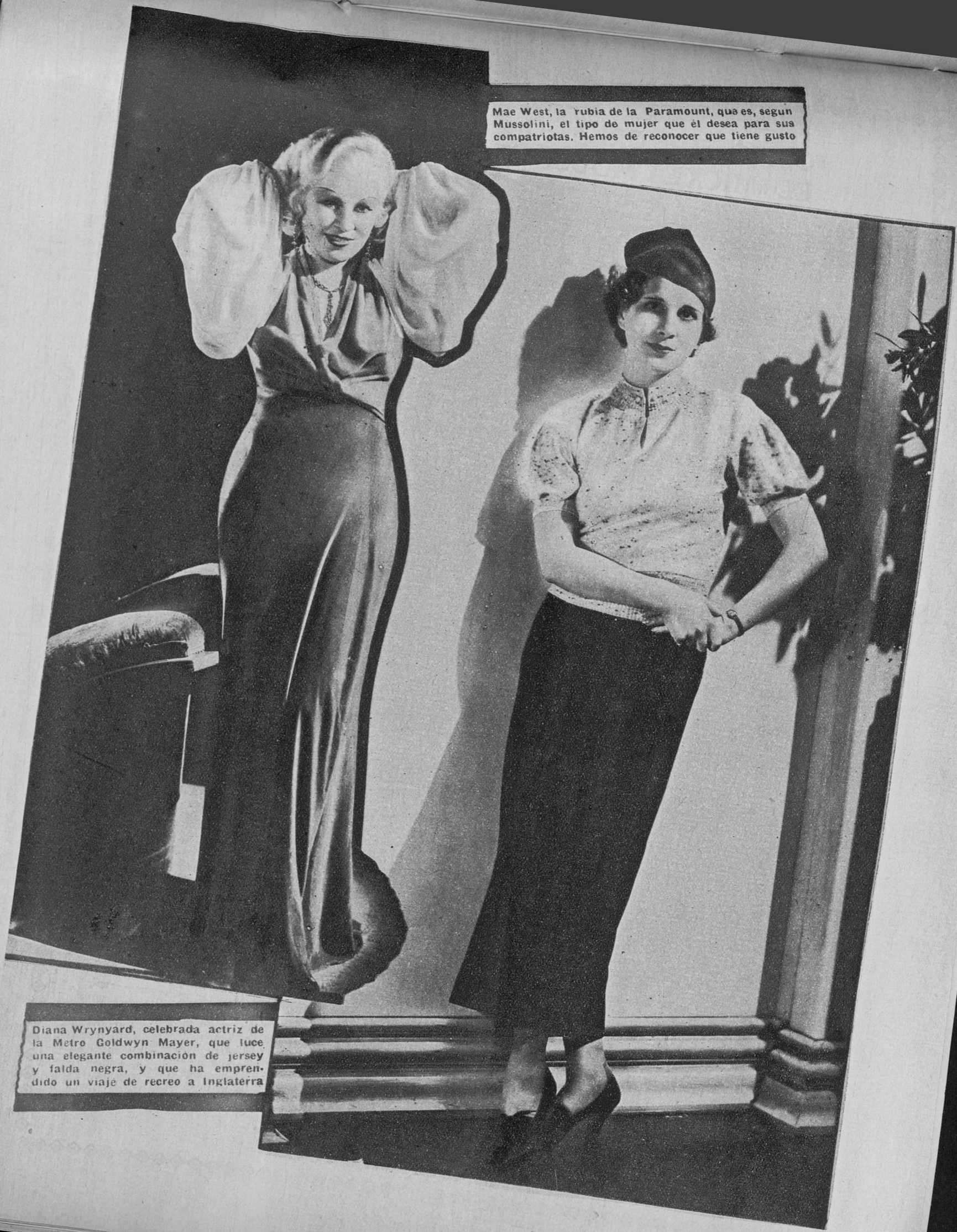
Mae West, la rubia de la Paramount, que es, según Mussolini, el tipo de mujer que él desea para sus compatriotas. Hemos de reconocer que tiene gusto