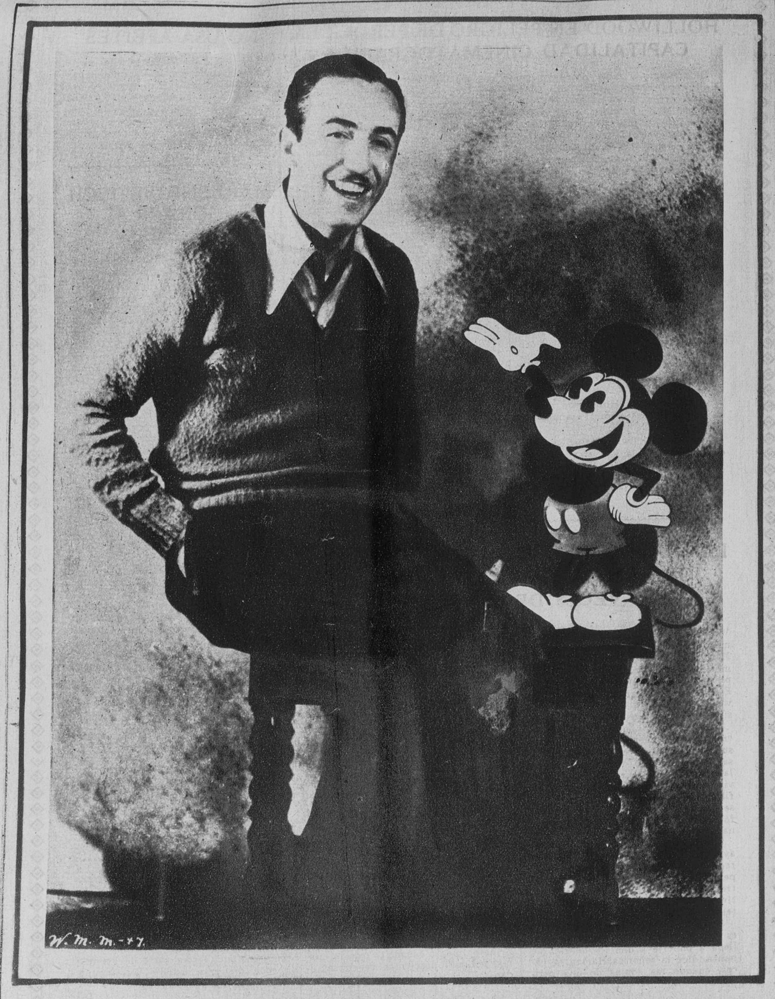
Walt Disney, el dibujante creador de Mickey Mouse, aparece en la fotografía en unión del famoso muñeco que hace las delicias de los pequeñuelos del mundo entero