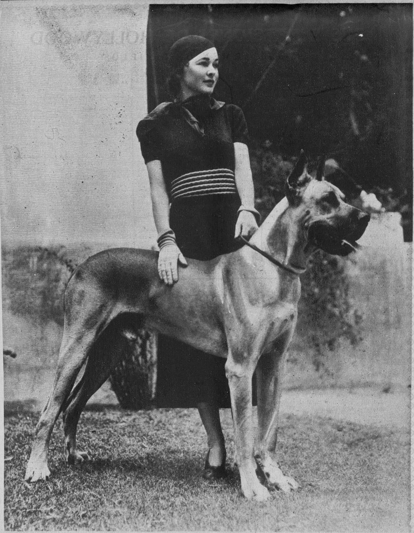
Maureen O'Sullivan, actriz de la Metro Goldwyn Mayer, aparece en esta fotografía acompañada de «Printz Erick of Willow Run», hermoso perro de raza danesa