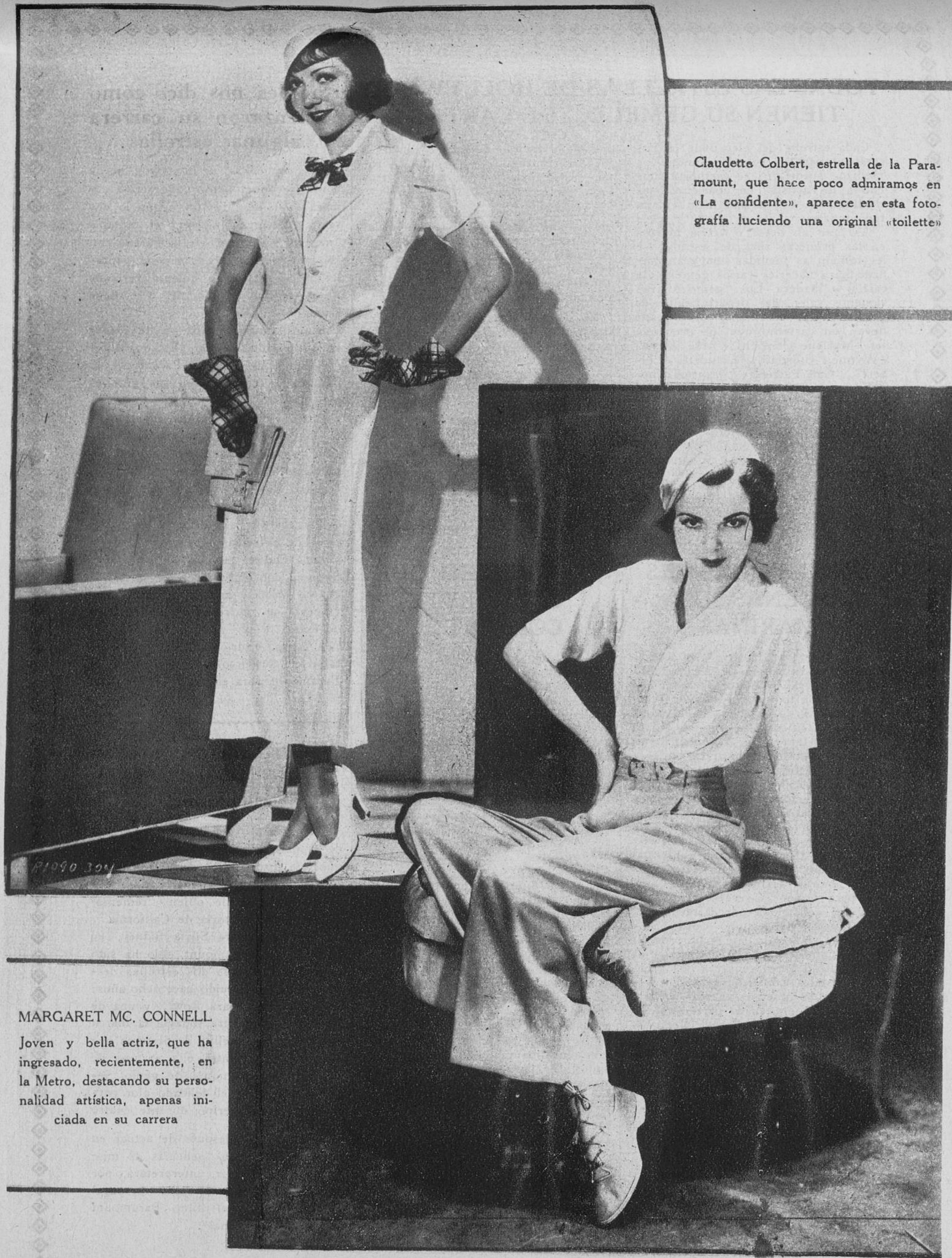
Claudette Colbert, estrella de la Paramount, que hace poco admiramos en «La confidente», aparece en esta fotografía luciendo una original «toilette»