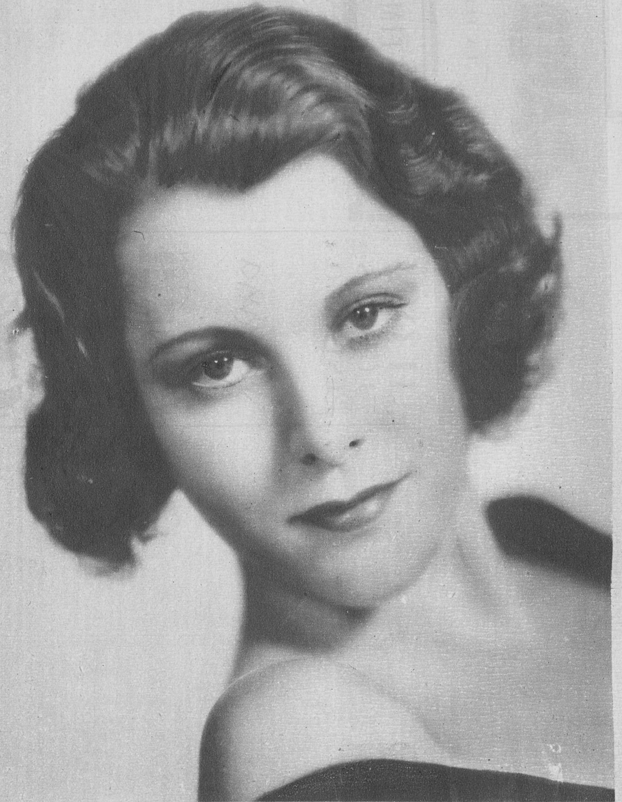
La encantadora artista de la Paramount Frances Dee

Venta en todas las farmacias, al precio de 8'50 pesetas frasco, por correo 8'50. Laboratorio "PESQUI", Alameda, 17, San Sebastián (Guipúzcoa) España