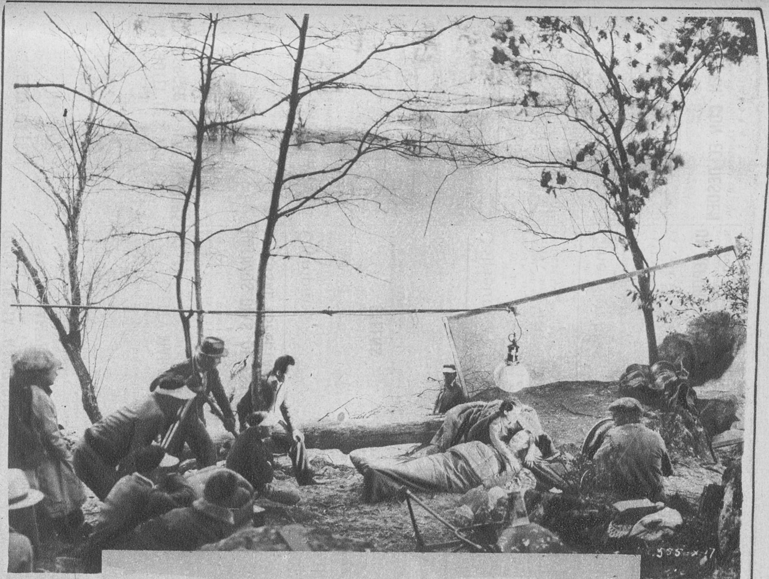
CLARENCE BRAWN, DIRECTORA NORMA SHEARER Y A LIONEL BARRYMORE, EN UNA ESCENA DE UN FILM M. G. M.