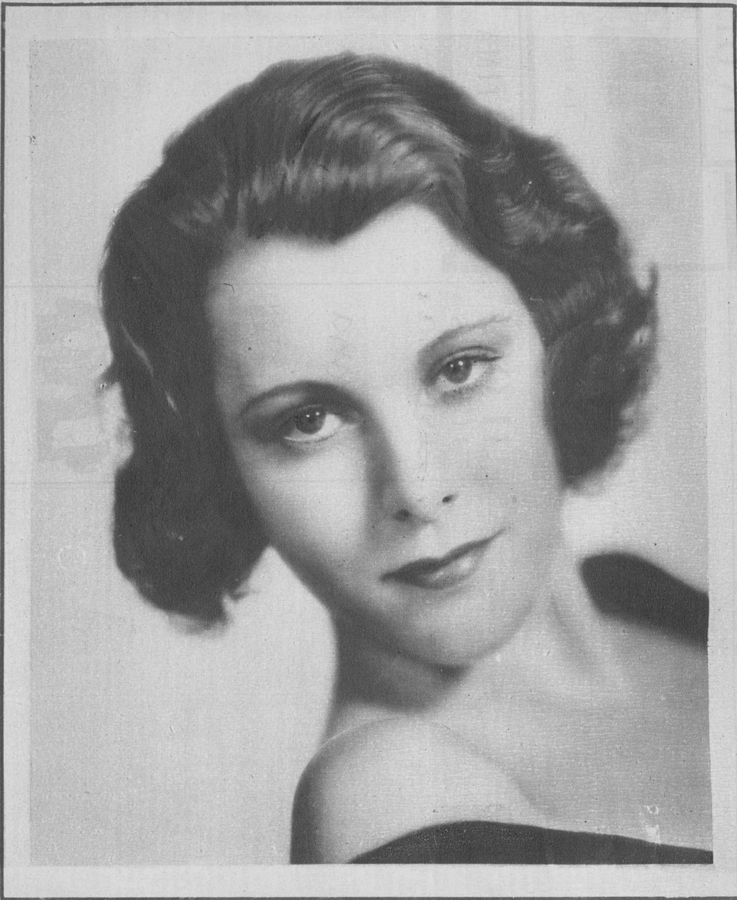
La encantadora artista de la Paramount Frances Dee