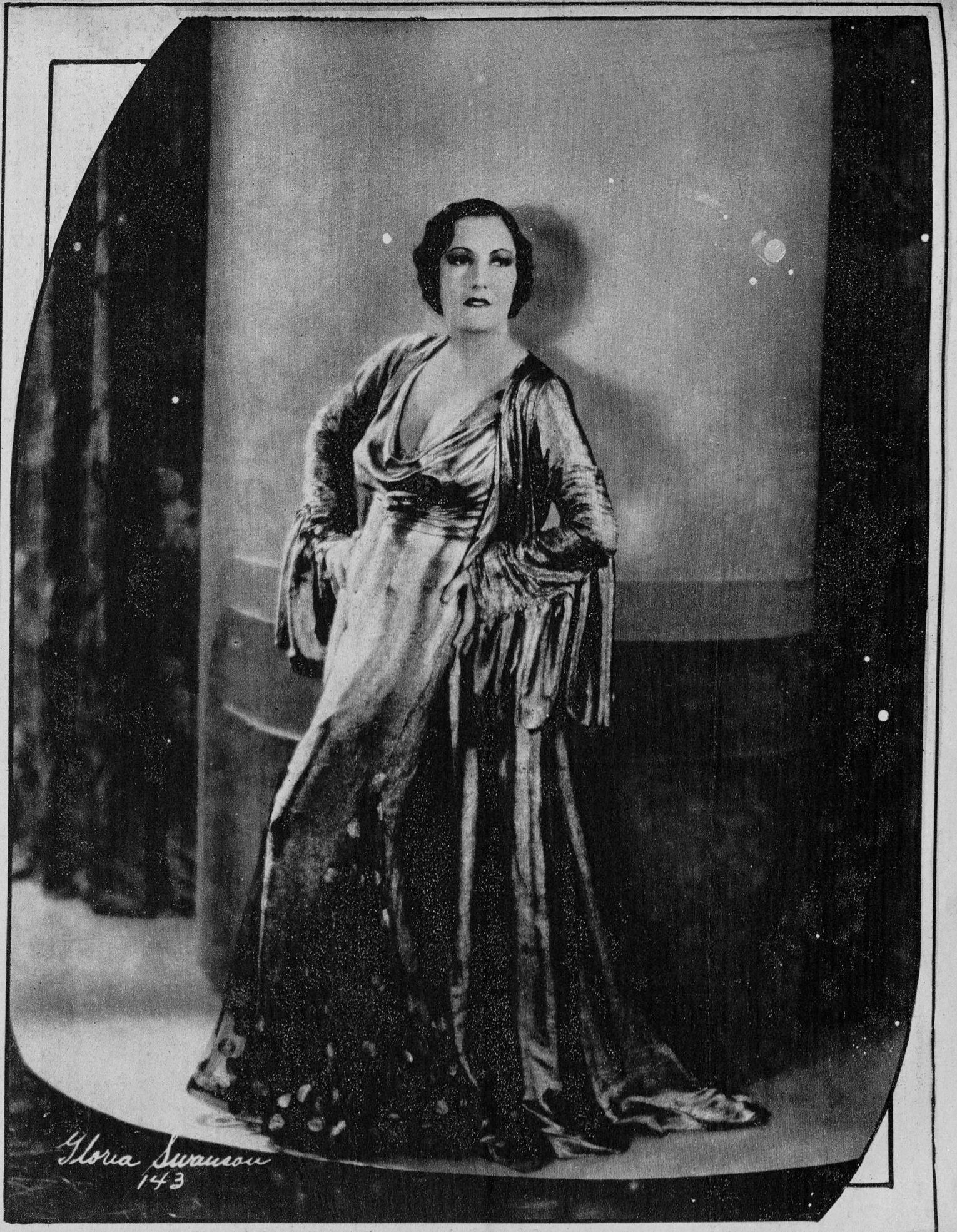
La célèbre artista Gloria Swanson