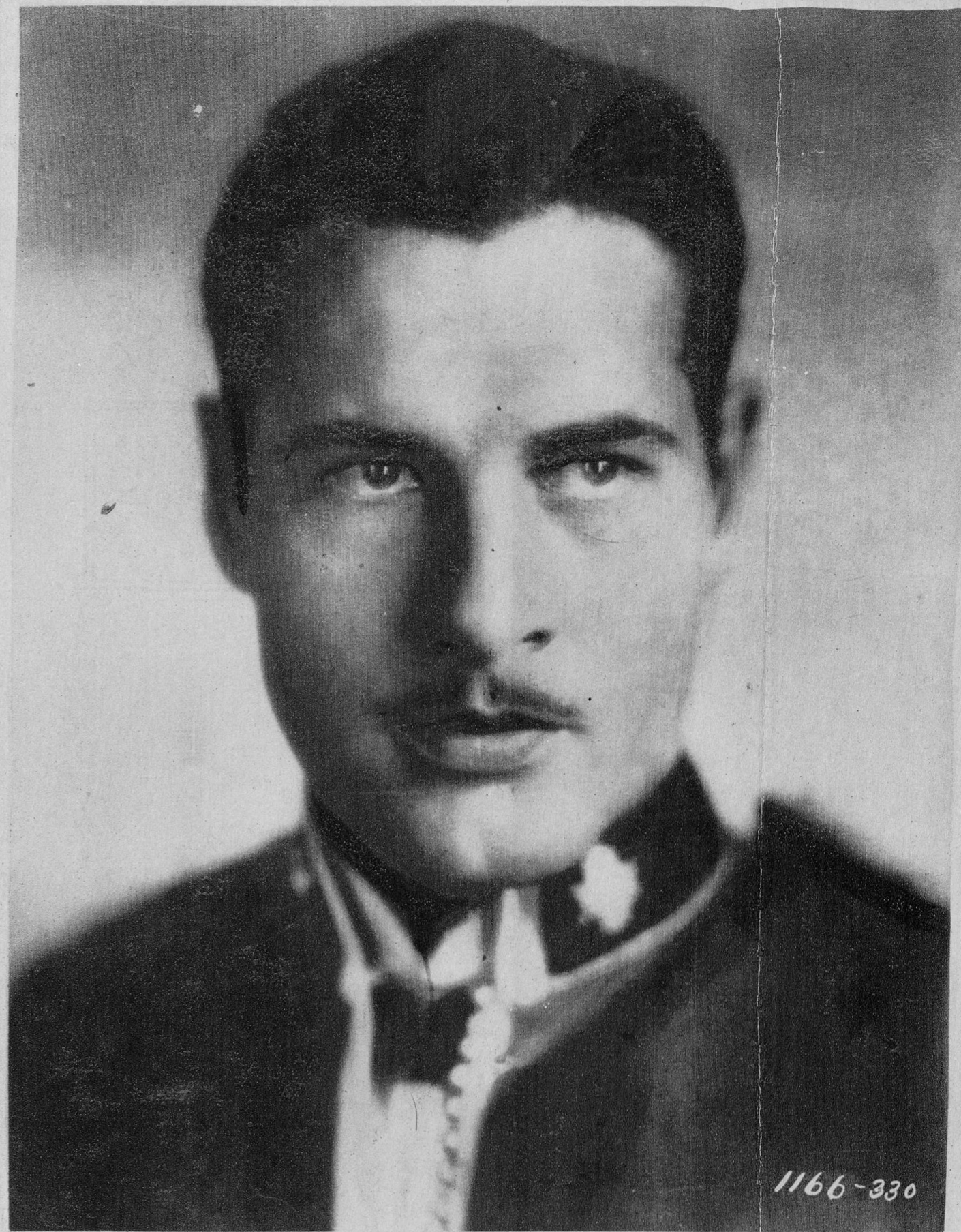
El famoso actor de la Paramount, Richard Arlen