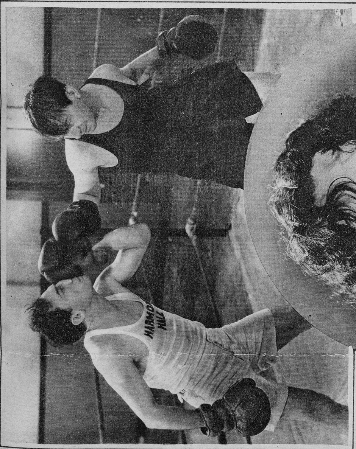
BUSTER KEATON Y SID TAYLOR, EN UNA GRACIOSA PELEA