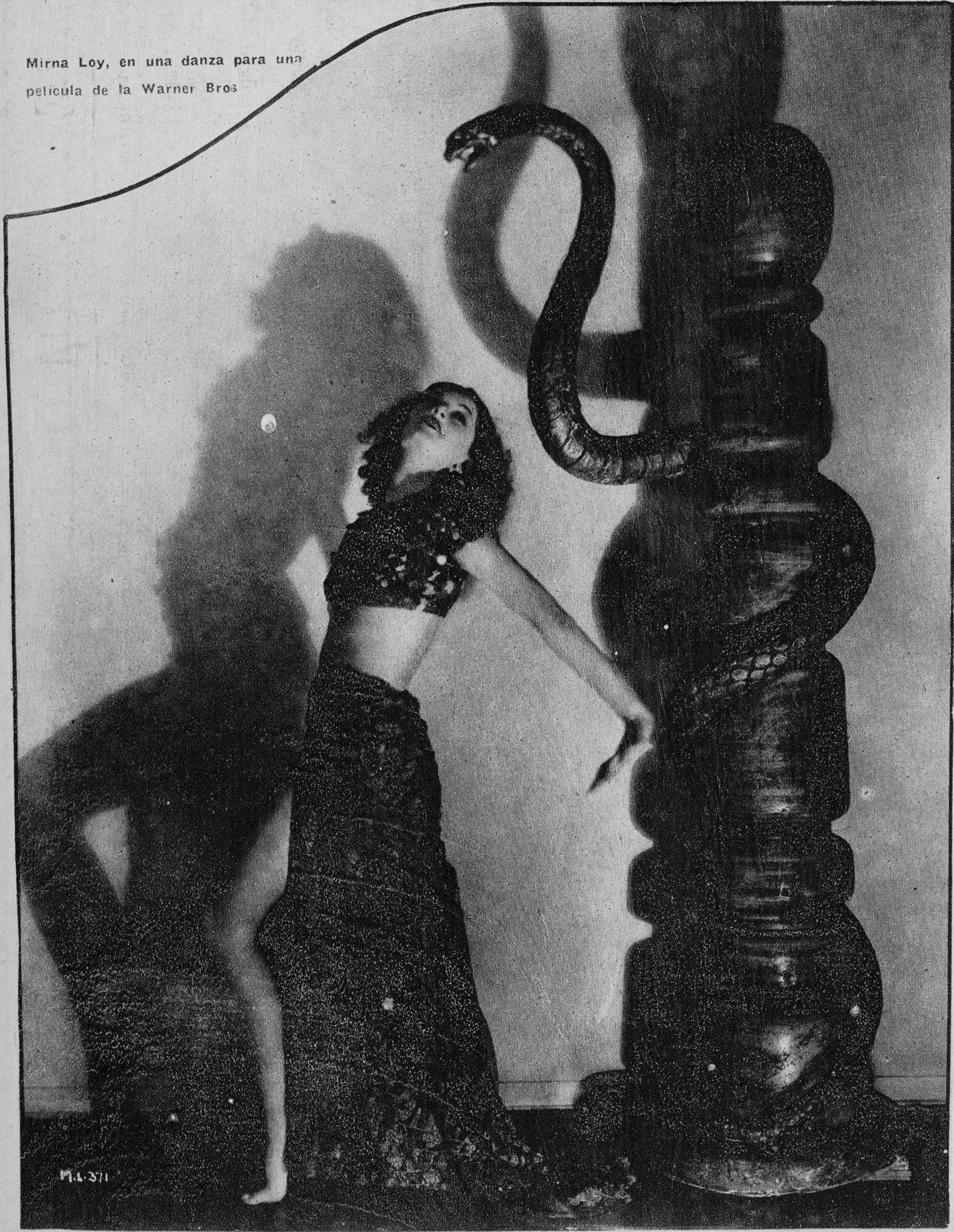
Mirna Loy, en una danza para una película de la Warner Bros