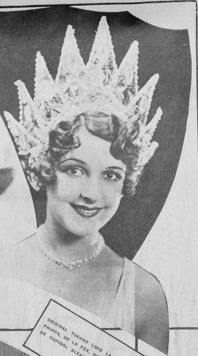
ORIGINAL TOCADO LUCE LA BELLA SALLY PHIPPS, DE LA FOX, QUE EN «LA ESCUELA DE CUPIDO» ALCANZO LA PRIMERA NOTA