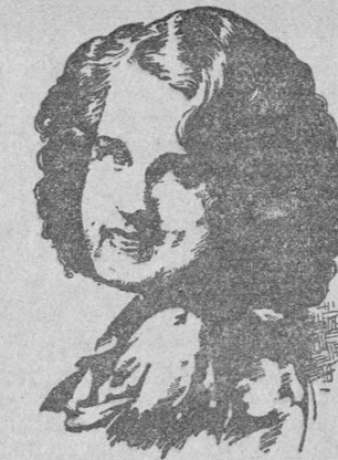
NORMA SHEARER

dispensable. Su actitud en el estudio es la de un sabio que acudiese al laboratorio para proseguir a sus anchas un experimento que demanda absoluta tranquilidad.