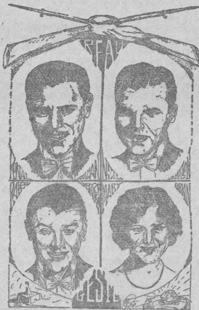
LOS PROTAGONISTAS DE «BEAU GESTE» (Por Pilar de la Guardia, de Barcelona)

ra vuestro zar y para vuestra Rusia; ciego de furor, usted le cruza la cara de un latigazo. No he de recomendaros un gesto que supongo conocéis demasiado ¿no es verdad?