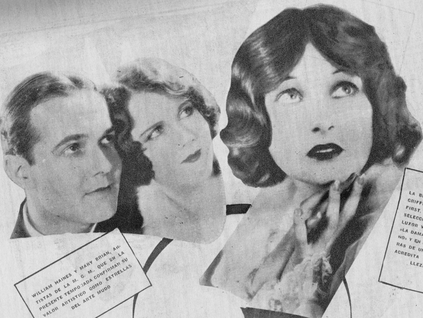
WILLIAM HAINES Y MARY BRIAN, ANFITRISTAS DE LA M. G. M. QUE EN LA PRESENTE TEMPORADA CONFIRMAN SU VALOR ARTISTICO COMO ESTRELLAS DEL ARTE MUDO