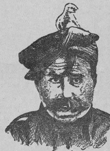
SIDNEY CHAPLIN (Por Tomás Vifias Boix, de Sallent)