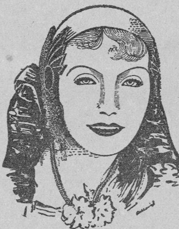
MISS GRETA GARBO (Por Angel Pallarés, de Sallent)