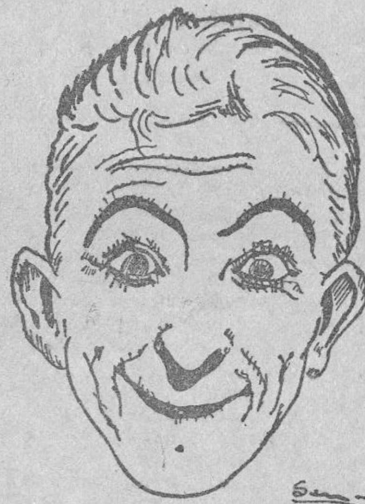
LARRY SEMON (TOMASIN) (Por Miguel Serra Cassá, de Barcelona)

jarán en la producción «Dirigibles», de la familia de «Alas». El Ministerio de Marina de los Estados Unidos ha prometido la cooperación de la Marina para las escenas navales que se impresionarán en las costas del Pacífico.