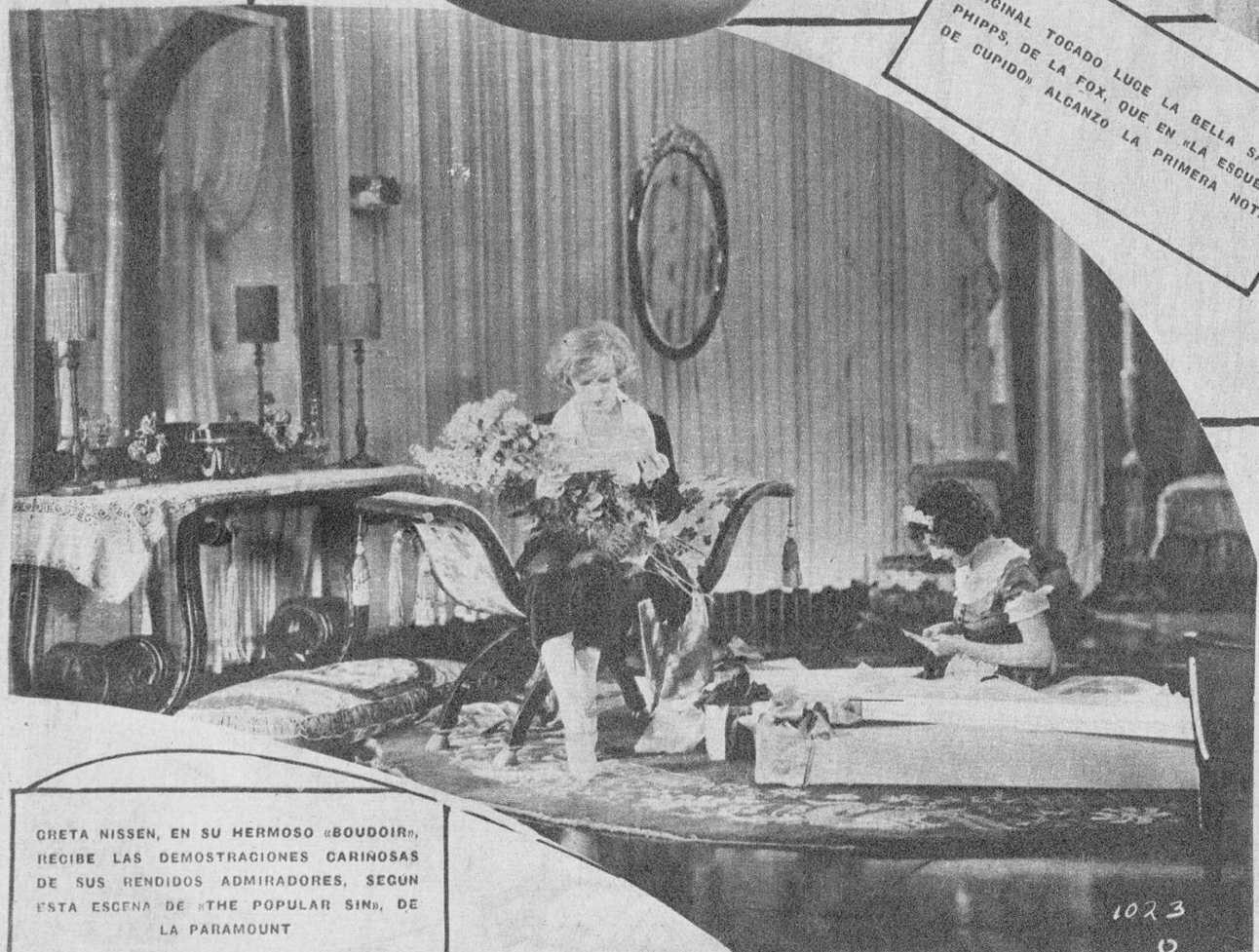
GRETA NISSEN, EN SU HERMOSO «BOUDOIR», RECIBE LAS DEMOSTRACIONES CARINOSAS DE SUS RENDIDOS ADMIRADORES, SEGUN ESTA ESCENA DE «THE POPULAR SIN», DE LA PARAMOUNT