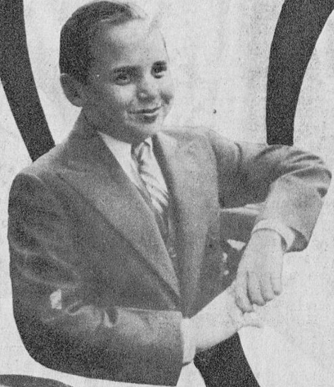
JACKY COOGAN, LA MINUSCULA ESTRELLA, QUE ABANDONA, MOMENTANEAMENTE, EL CINE, Y QUE DEBUTARA EN UN MUSIC-HALL DE PARIS