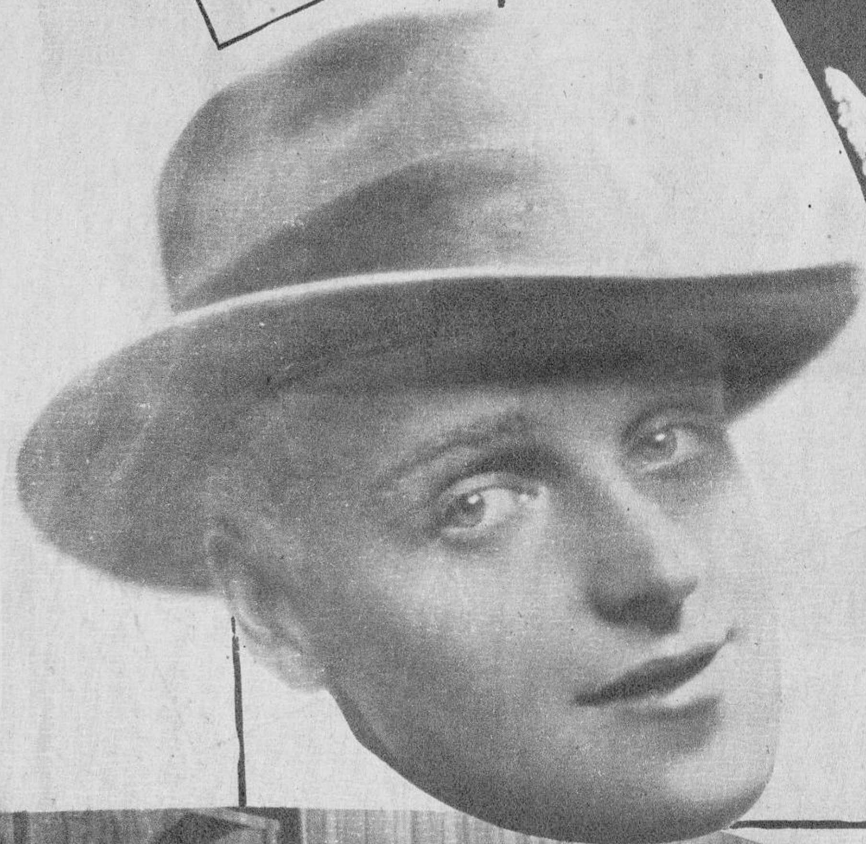
EN «LOS CUATRO HIJOS», GEORGE MEEKER, EL CELEBRADO ACTOR DE LA FOX, CONSIGUE UN MERECIDO TRIUNFO PERSONAL