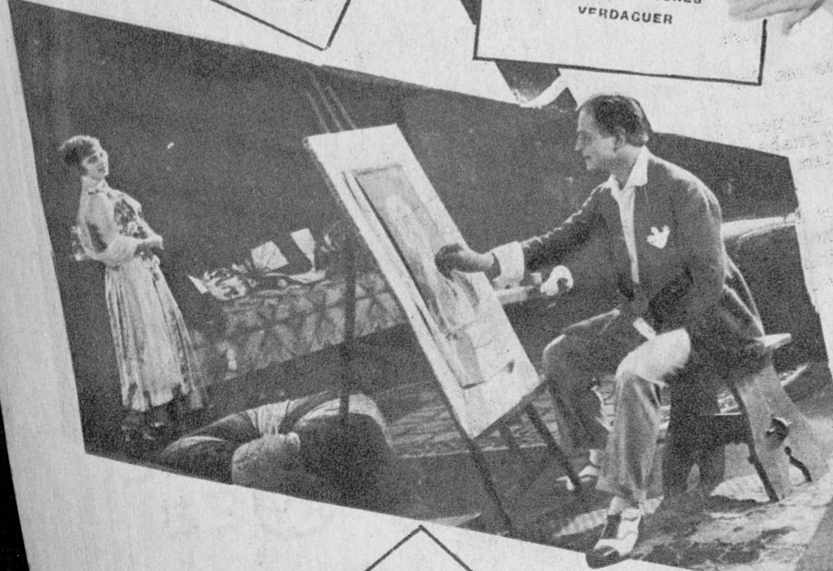
TODO SU ENTUSIASMO ARTISTICO EN: «PLAZA GASTON JACQUET PARA COPIAR LA LINDA FIGURA DE COTELLE BARFENIL EN EL FILM «NON PLUS ULTRA» MIOE DEL AMORE»