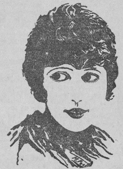
MABEL NORMAND

nema requiere ciertos principios arquitectónicos aplicados a tema determinado. Y éste debe expresarse más con ojos de pintor o de ilustrador que de arquitecto. Y antes de diseñar con éxito un escenario, el director artístico tiene que reconocer el drama y percibir el valor de las situaciones, para las cuales debe crear el ambiente.