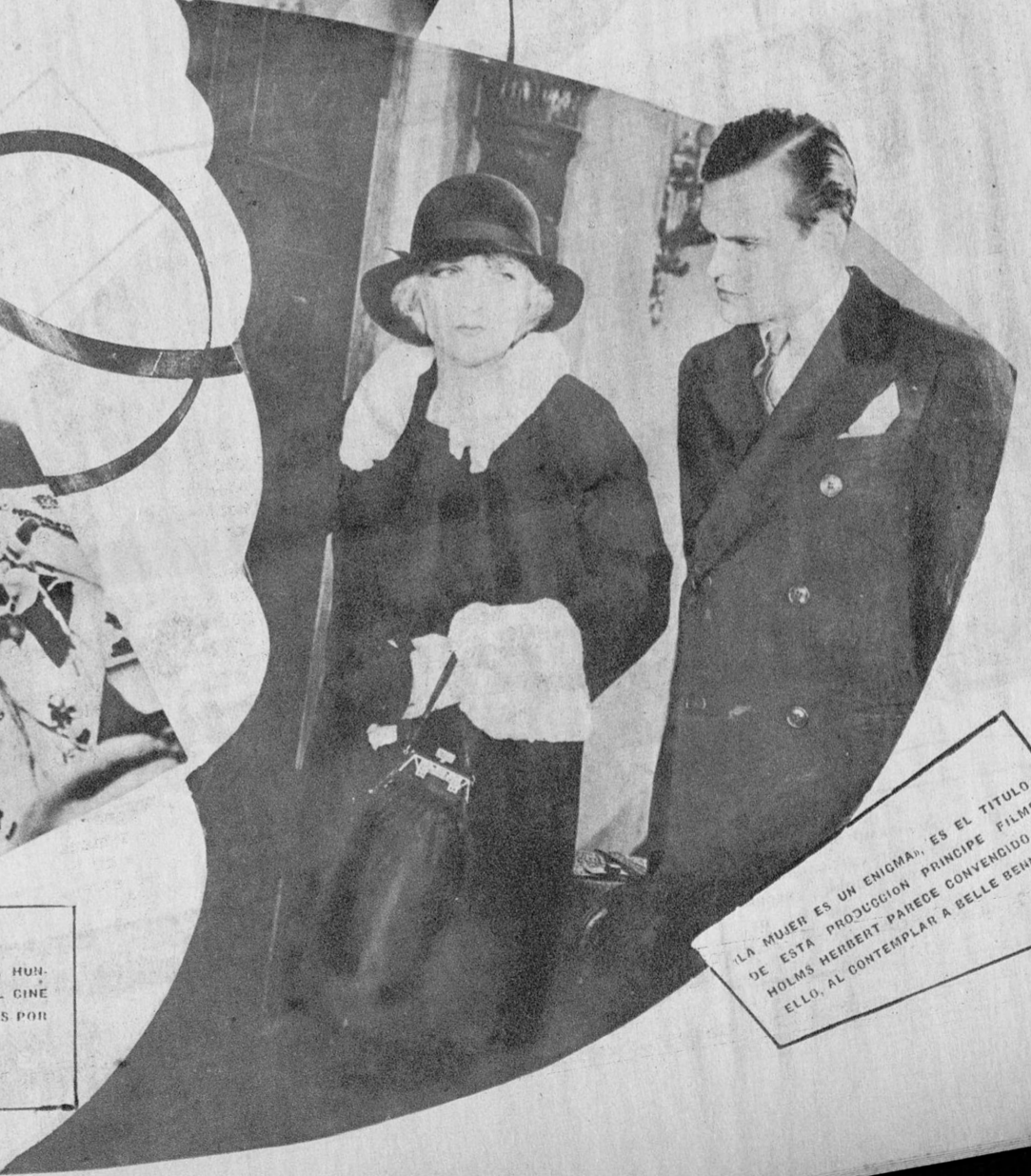
«LA MUJER ES UN ENIGMA», ES EL TITULO DE ESTA PRODUCCION PRINCIPAL FILMS HOLMS HERBERT PARECE CONVENIDO DE ELLO. AL CONTEMPLAR A BELLE BENNET...