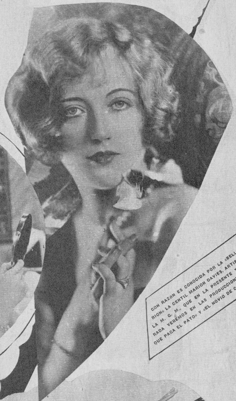
CON RAZON ES CONOCIDA POR LA «BELLA MARION»: LA CENITIL MARION DAVIES, ARTISTA DE LA M. C. M., QUE EN LA PRESENTE TEMPORADA VEREHOS EN LAS PRODUCCIONES «LA QUE PAGA EL PATON» Y «EL NOVIO DE CARTON»