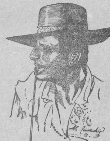
DOUGLAS FAIRBANKS

cordarán nuestros lectores fué el asombro de los reporteros neoyorquinos y del mundo elegante a su llegada a América, por sus «toilettes» audaces y por su «chic» inigualable, es una mujer, según dicen los directores americanos, de un gran temperamento y un genio y vivacidad insospechados.