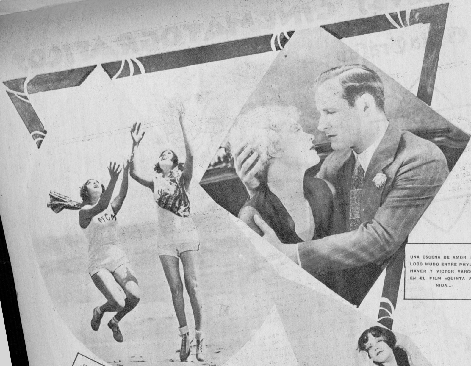
UNA ESCENA DE AMOR, DIÁLOGO MUDO ENTRE PHYLLIS HAVER Y VICTOR VARCONI, EN EL FILM «QUINTA AVENIDA...»