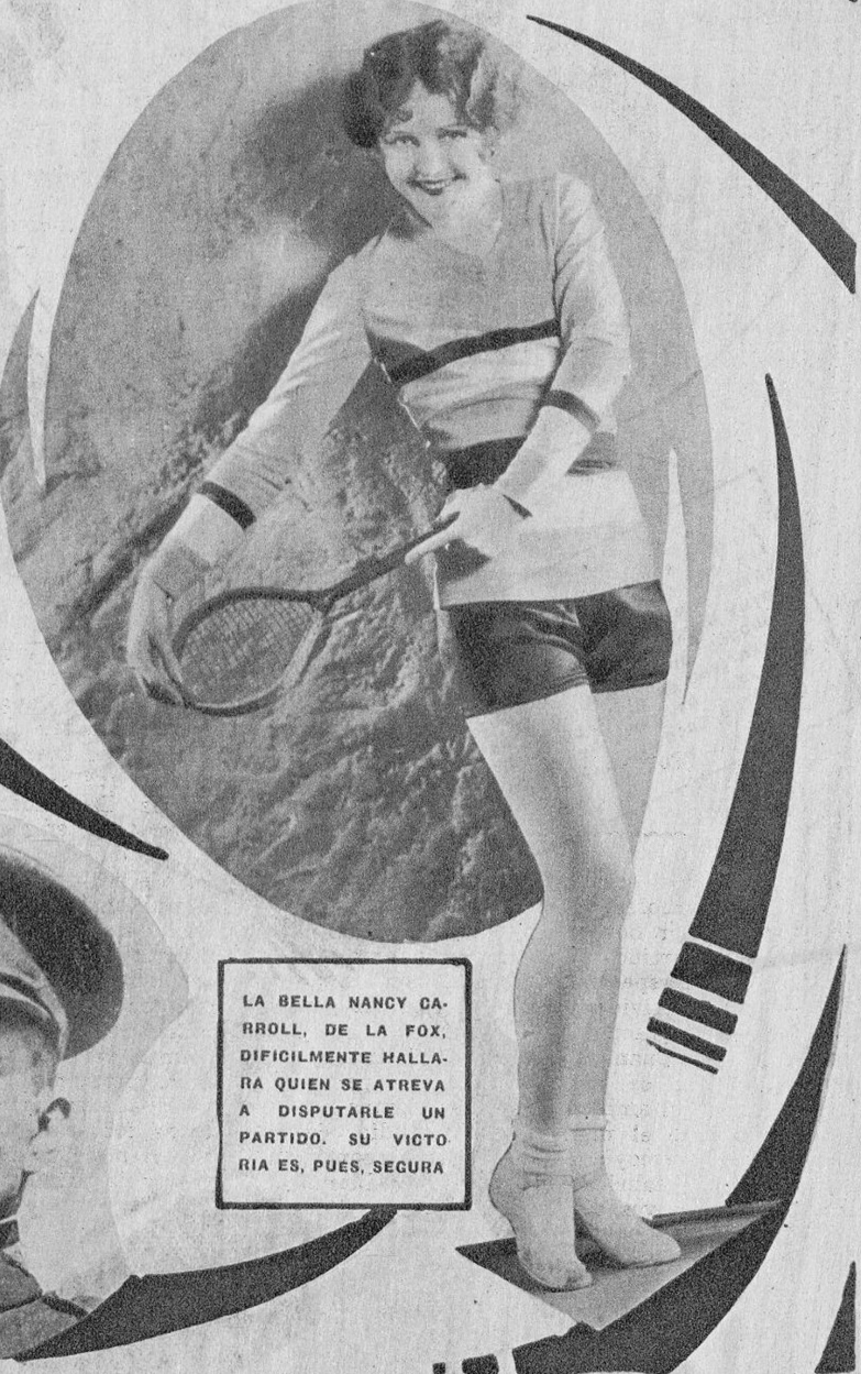
LA BELLA NANCY CARROLL, DE LA FOX, DIFICILMENTE HALLARA QUIEN SE ATREVA A DISPUTARLE UN PARTIDO. SU VICTORIA ES, PUES, SEGURA