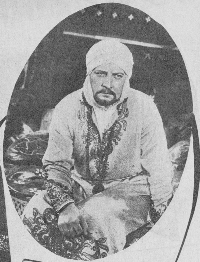
ALGUNAS ESCENAS DE LA MAGNIFICA PELICULA «BEN ALI», DE LAS «SELECCIONES GAUMONT DIAMANTE AZUL», QUE SE ESTRENARA PROXIMAMENTE EN LOS SALONES RIALTO Y PARIS