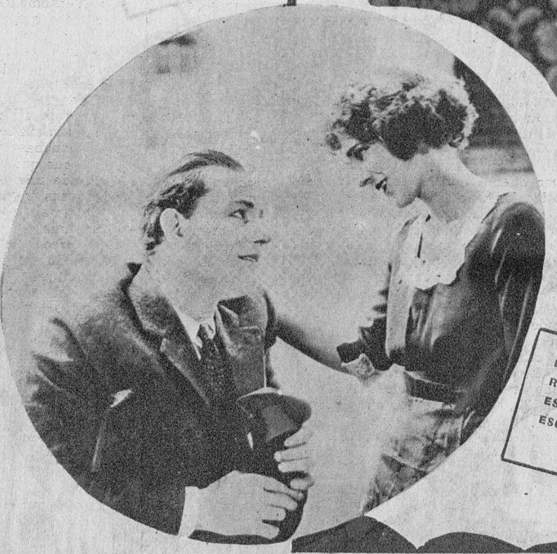
EL SENTIMIENTO DE LON CHANEY NO PARECE SER TOMADO MUY EN SERIO POR ESTA LINDA MUCHACHA, EN LA PRESENTE ESCENA DE «CORAZON DE PADRE», FILM «NON PLUS ULTRA»