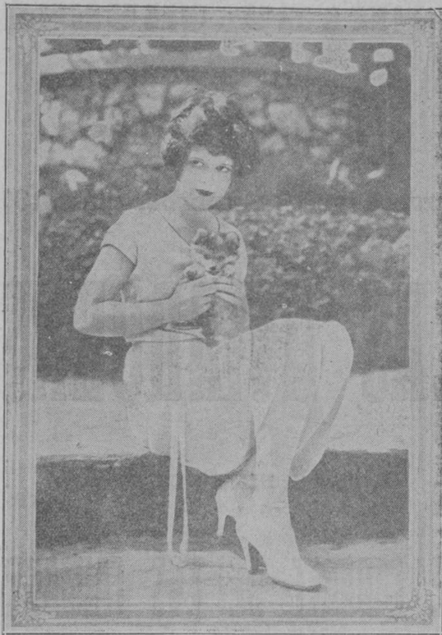
Esta es Clara Bow, la sugestiva y atrayente muñeca protagonista del "film" Paramount "Ello". Aquí, en España, no podemos sorprendernos de la belleza femenina, y sin embargo es tal la cantidad de "Ello" que Clara Bow posee, que no nos extrañaría la noticia de que algún español se decidiera a ir en busca de ella.