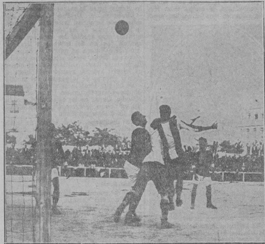
Granizo, "empaquetado" por Valmaseda y un "nacionalista", contempla la trayectoria de un balón alto en el partido jugado ayer entre la Gimnástica y el Nacional.

Por la noche, apenas iniciada la sesión, Cantabria presenta una proposición pi-