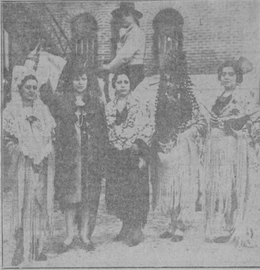
Distinguidas jóvenes que presidieron la becerrada de los zapateros.