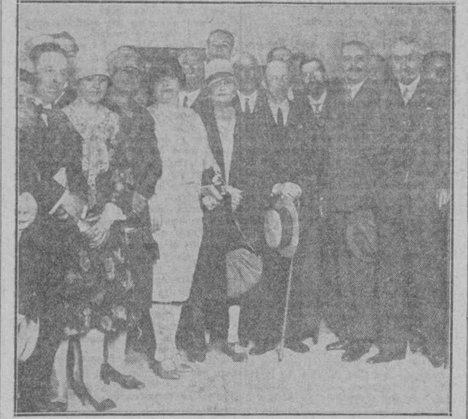
El ministro de Instrucción Pública rodeado por los congresistas en la visita que hicieron a la Casa de la Prensa.