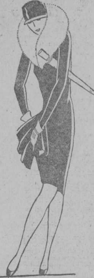
— ¡Qué groseros son los pollos de hoy! ¿Pues no acaban de preguntarme si me mantengo con fideos finos?