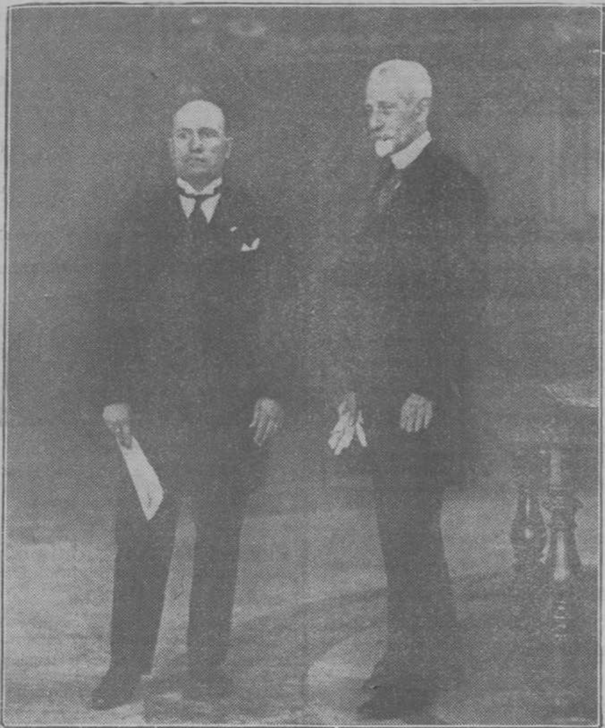
ROMA.—El general Averescu, jefe del Gabinete rumano, en unión de Mussolini, con quien ha pasado una temporada en la capital de Italia.