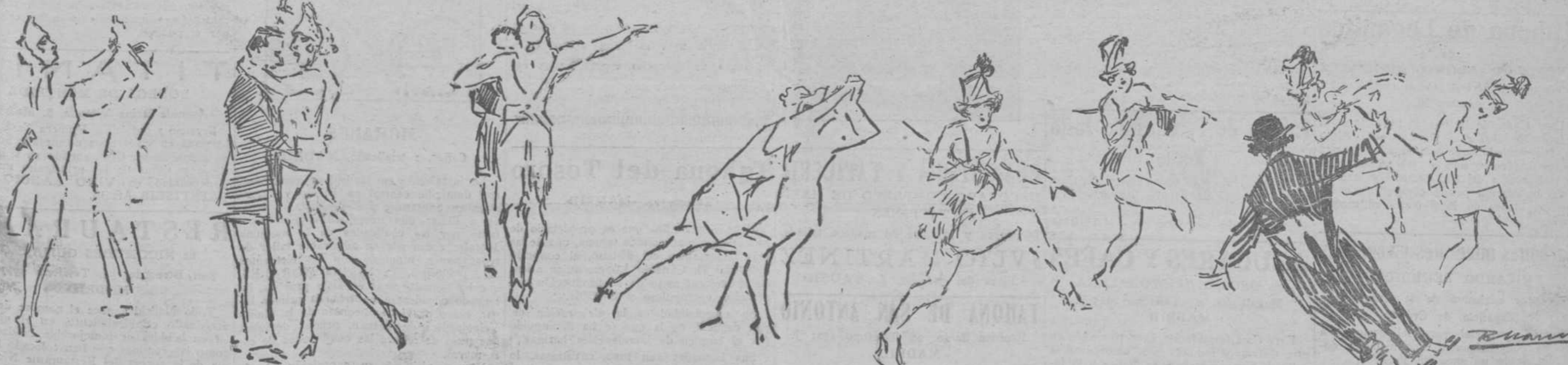
El "schotis" y el "charlestón" de "Las mujeres de Lacuesta"