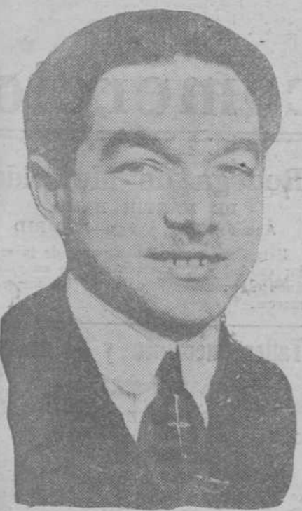
El aviador francés René Fonch, cuyo "saúd" París-Nueva York anuncian algunas Agencias telegráficas como suspendido indefinidamente.

En el Sanatorio Alemán, establecido en la calle de Francisco Silvela, 52, se declaró ayer un incendio, que se inició en la chimenea del edificio, propagándose rápidamente a la armadura. Acudió con rapidez el Servicio de Incendios, y pudo ser sofocado el siniestro, gracias a sus esfuerzos. No ocurrieron desgracias personales.