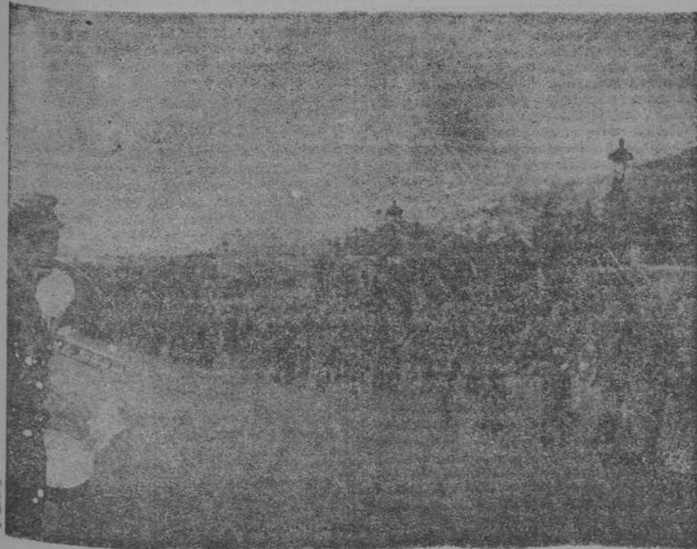
El desfile de las fuerzas de Carabineros