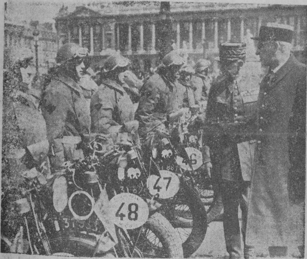
LA VUELTA A FRANCIA EN MOTOCICLETA Paris.—Son 120 los militares y civiles que participan en esta prueba de 5.000 kilómetros. El general Phillippe pasa revista a los participantes militares en la Plaza de la Concordia