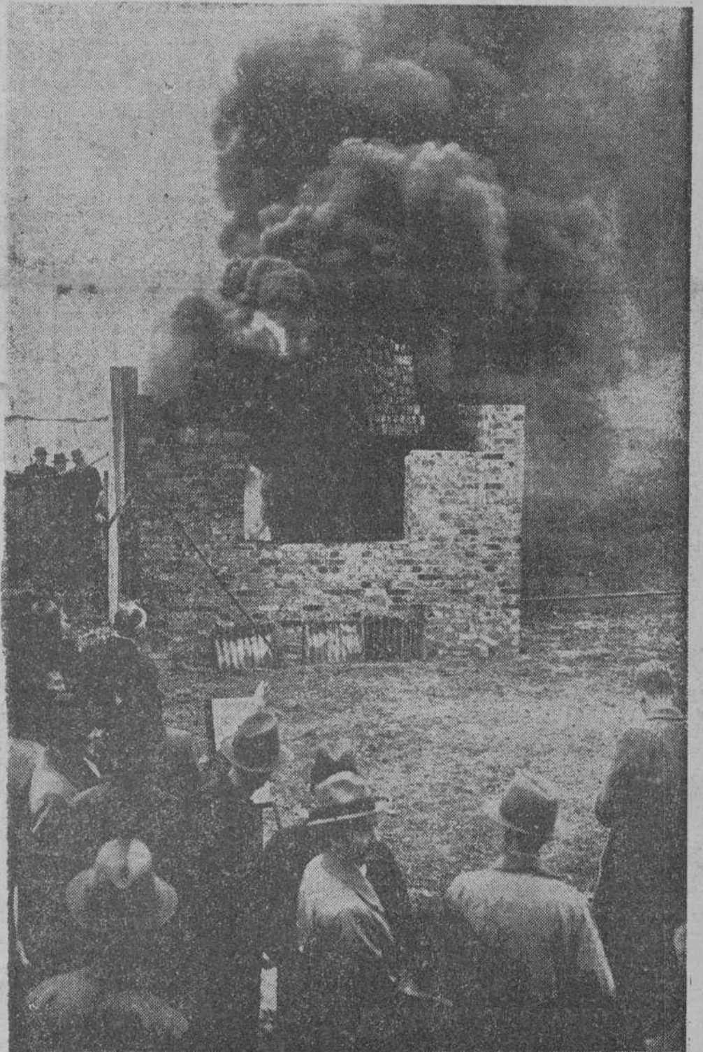
MATERIAL REFRACTARIO AL FUEGO

En Essex (Inglaterra) se ha hecho un ensayo con éxito, en el que ha quedado evidenciado que las construcciones de acero cuando están aisladas con amianto moldeado, son inmunes al fuego