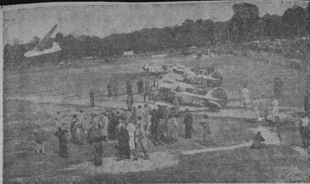
GERMAIN Doret, el as francés, pasa en planeador a pocos metros del suelo