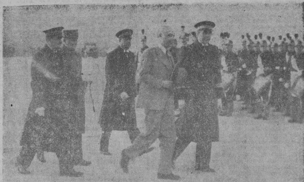
EL MINISTRO DE LA GUERRA DE INGLATERRA EN PARIS