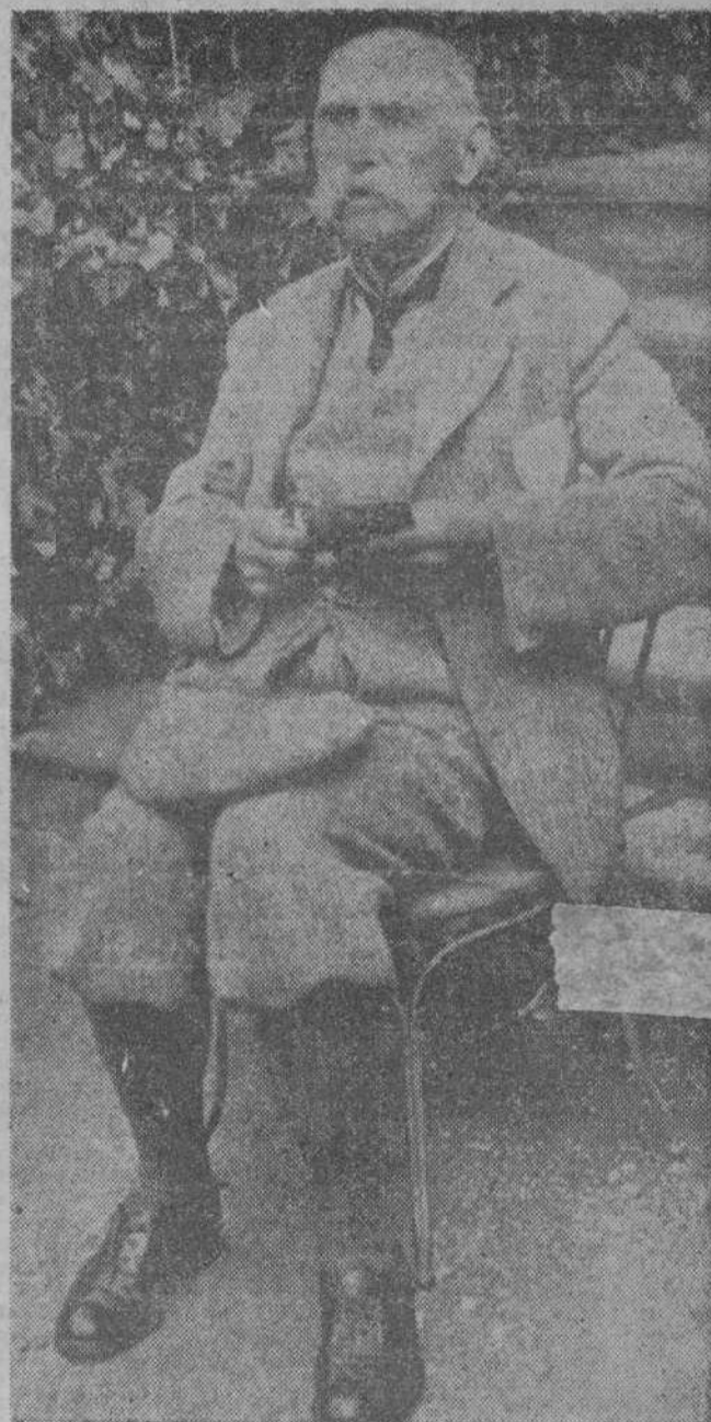
EL FUTURO PRESIDENTE DEL EIRE