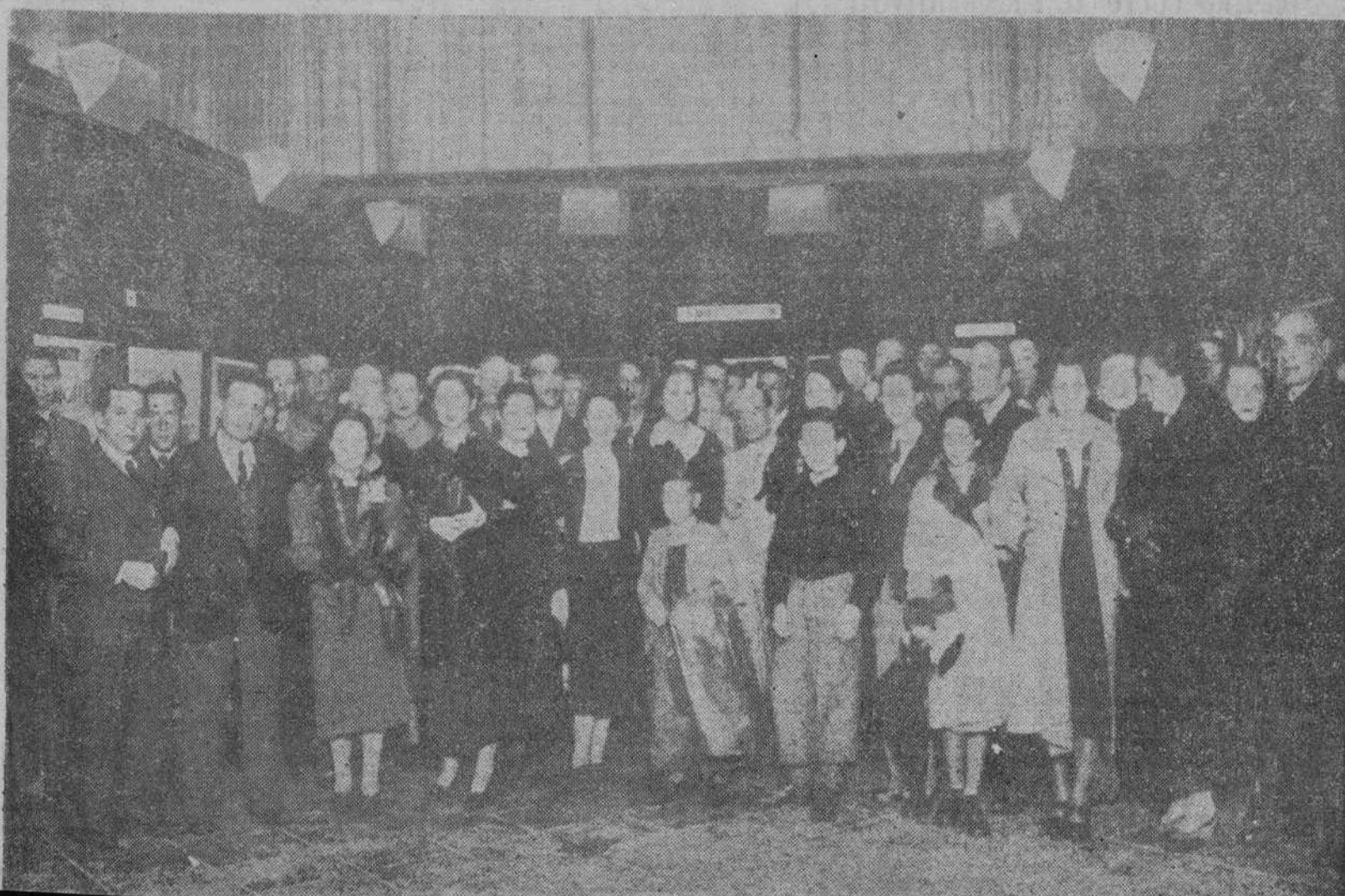
Acto de la clausura oficial de la Exposición de carteles anunciadores de los acreditados CUBITOS DE CALDO "CALDOLLA" que con tanto éxito ha vendido celebrándose durante diez días, en los salones de las Galerias Layetanas