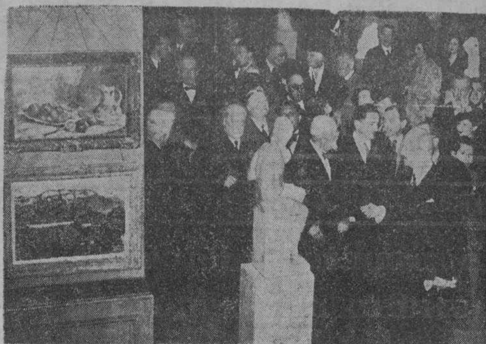
LA EXPOSICION NACIONAL DE LOS INDEPENDIENTES EN PARIS Ha sido inaugurada por M. Lebrun