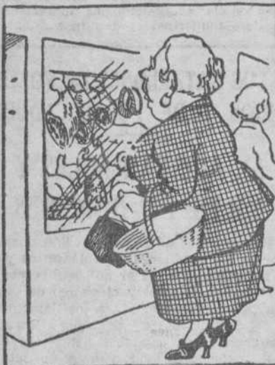
La Zolla, con ilusión, un escaparate mira, donde hay longaniza en tira, cerdo, pollos y jamón.