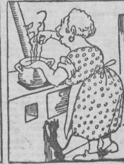
Al puchero, con recelo, lo echa cuando llega a casa, esperando ver qué pasa y si la han dado el camelo.