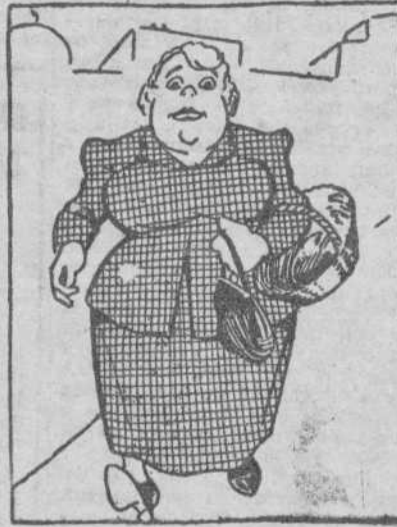
Pero va por "congelada" y unas coles y monchetas, que al fin de mes, las pesetas, dejan la bolsa agotada.