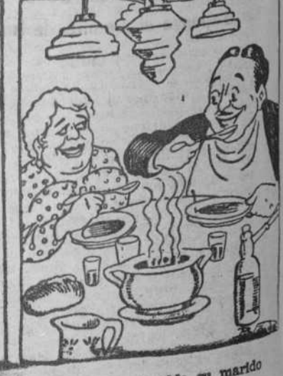
Prueba el caldo su marido y se cree muy complacido, que es de gallina la olla, y ella ríe, porque sabe que el secreto del cocido es un cubito "CALDOLLA".

DE VENTA EN COLMADOS FABRICA Y DESPACHO: PARADIS, 4 -- Teléfono 20107 -- BARCELONA