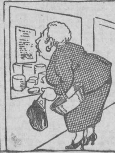
Se encuentra otro escaparate en donde anuncia una cosa, tan barata y asombrosa, que parece un disparate.